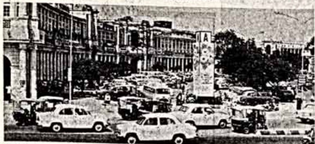
Центральная площадь индийской столицы — Колкот-найд.

Как посланца мира и дружбы ждет сейчас Индия высокого советского гостя — Генерального секретаря ЦК КПСС Михаила Сергеевича Горбачева, чей официальный дружественный визит сюда станет еще одним знаменательным событием в истории советско-индийского сотрудничества.