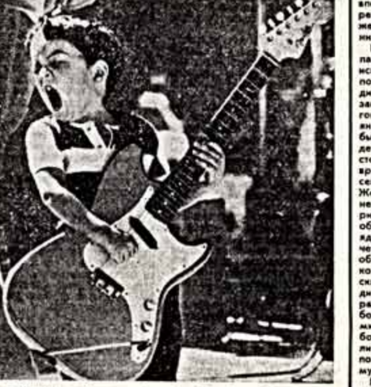
Снимок, публикуемый под этой рубрикой, можно не комментировать. Он не заслуживает иного. Просто ему очень нравится играть. И ему нужен мир на земле, которая услышит его, а может, будет и алоидировать ему.