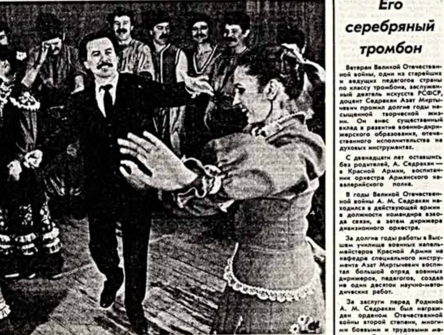
На репетиции. (Художественный руководитель Государственного Кубанского казачьего хора, народный артист РСФСР коллоратор Виктор Захарченко).