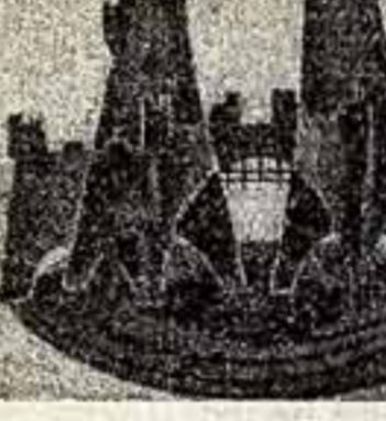
Г. Гуния. Эскиз декорации к «Ричарду III» Шенсера.