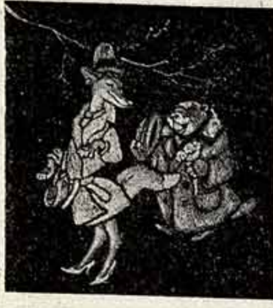
Е. Рачев. Иллюстрация к басне С. Михалкова «Лиса и бобр».