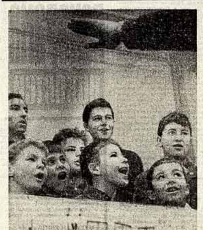
Утренняя сценка — это зарядка на целый творческий день.

И не забываям ли в то же время о проблемах искусства, создаваемого для детей. Кисти, и выставки художников — иллюстраторов детских книг — стали редки в последние годы.