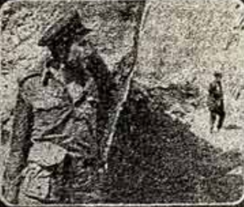
«ПОЕДИНОК В ГОРАХ»