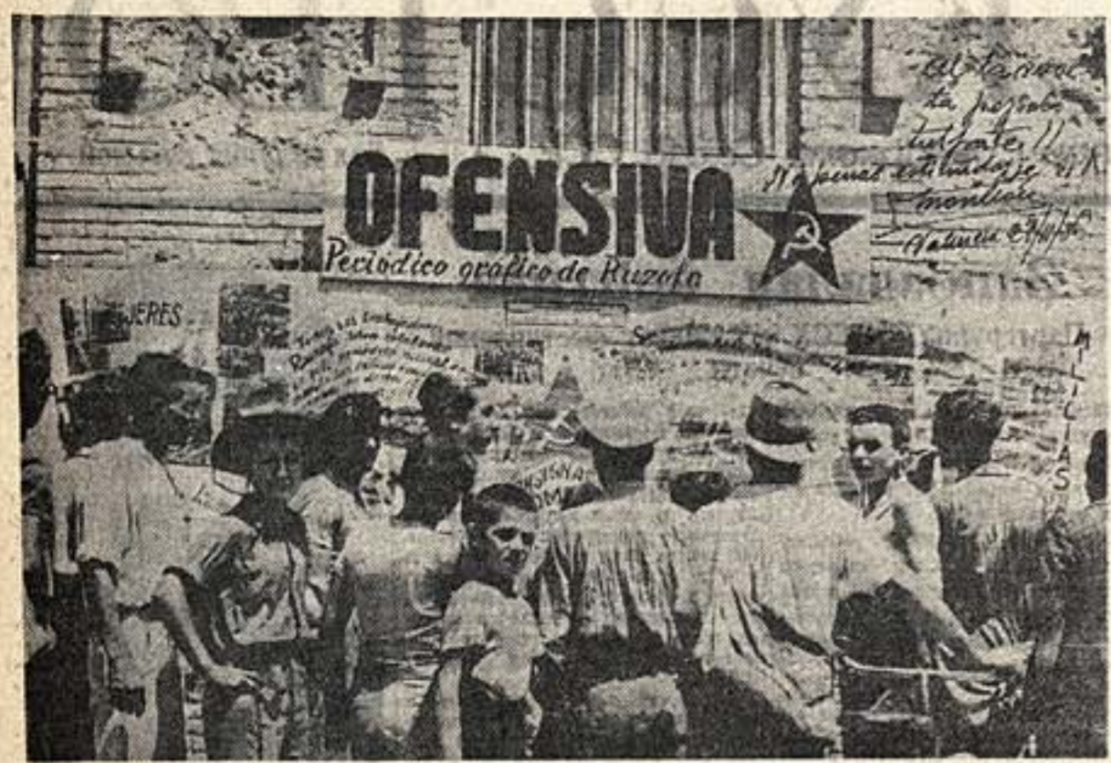
Уличная стена в Валенсии, смонтированная на стенах домов художником Мануэлем Молеоном.