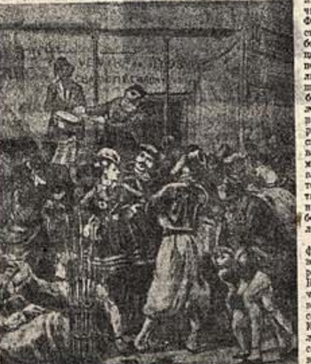
Бульвар Сен-Мартина в первые дни Коммуны (со старинной гравюры)

В это же время в Париже происходило развитие театра. Многие театры закрывались, но некоторые продолжали работать.