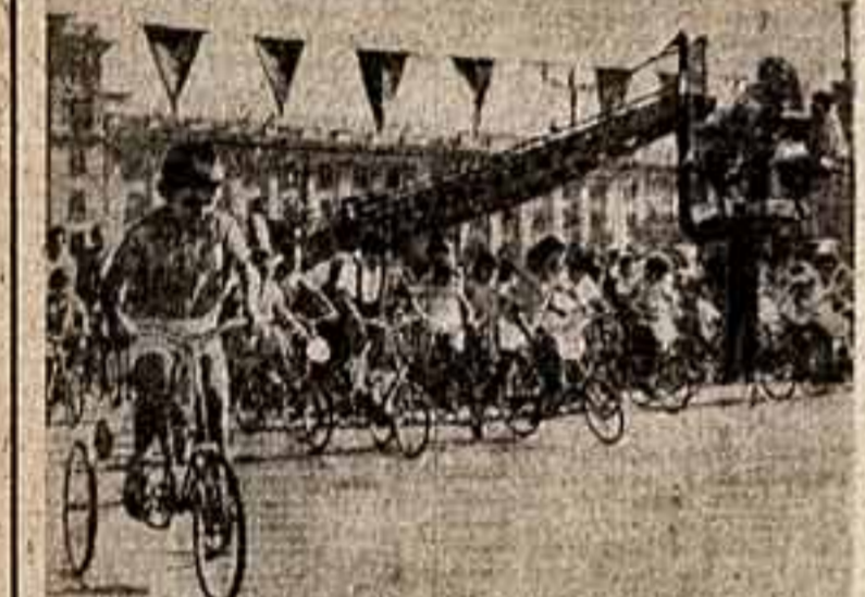
Сравнения на велосипедах. Вы увидите этот эпизод в картине «Последний месяц осени»...

И ОДИН ВИД ИСКУССТВА, исключая, может быть, миниатюры... Как выглядело искусство советской книги на международном форуме в Лейпциге?