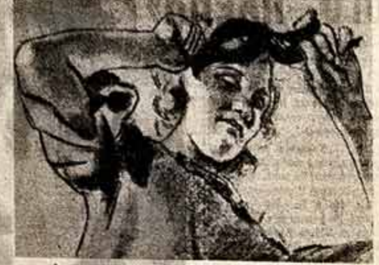
Е. Лансер. Подготовительный рисунок и роспись плафона в гостиной в Москве, 1936 г.

С ЕГОДНЯ исполняется двадцать лет со дня рождения замечательного советского художника Евгения Евгеньевича Лансера (1945—1965). Мастер большого и свободного дарования, Е. Е. Лансер много сделал для развития советского изобразительного искусства. Его творчество выросло из народной красоты, той волею современности наполнила трудом и дни народа. Ему много обязана наша книжная графика и искусство сувенирной декорации; в истории советской живописи прочно занял свое место его монументальное искусство и произведения на темы героической истории Родины.