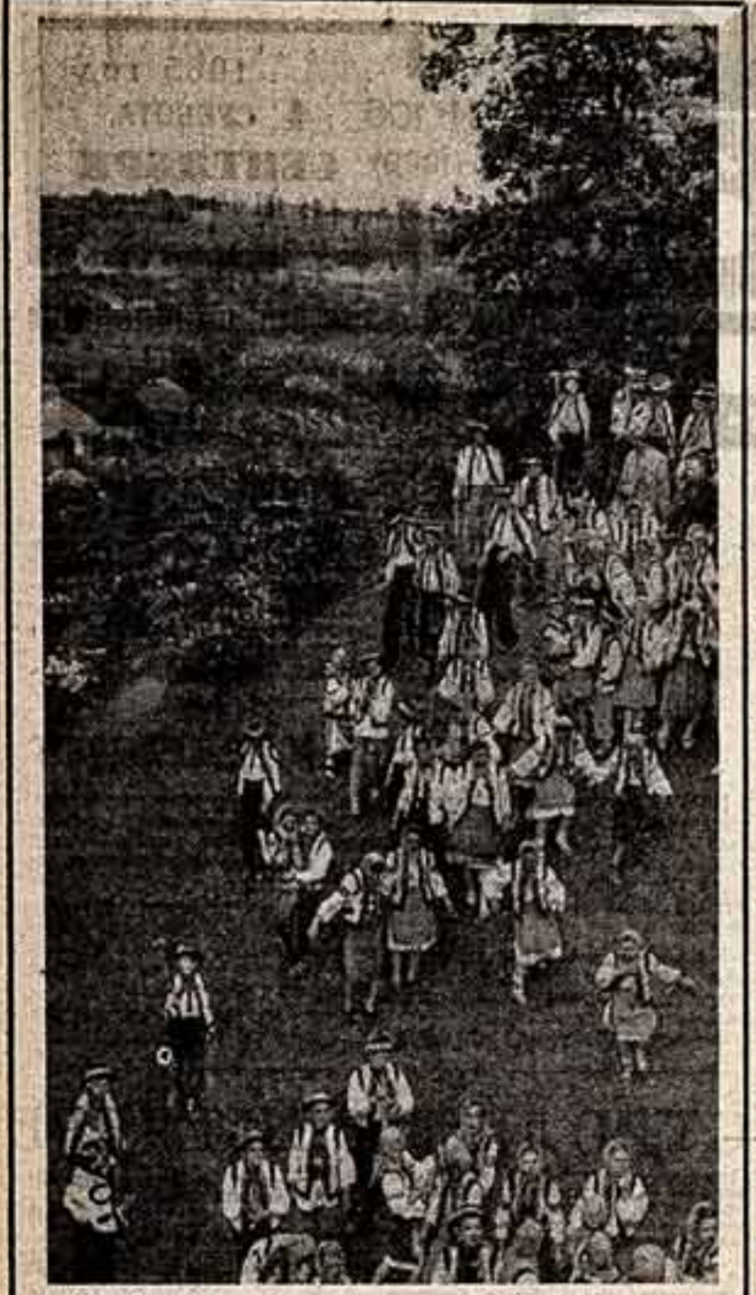
Иванов-Франковский, область (Украинская ССР). Этот край с полным правом называют землей художников. Каждый садовод, дачник, каждое лето в саду или в поле, либо мастеров художественного ремесла, ткачей. Широко известны в стране и за рубежом западноукраинские мастера керамики. Не менее популярны на Юго-Западе и карпацкие мастера ювелирного искусства.