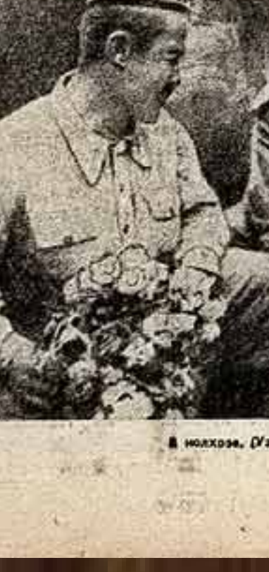
В молоте, «Воскрески».