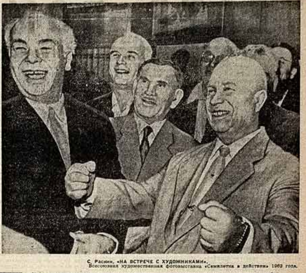
С. Ракин. «НА ВСТРЕЧЕ С ХУДОЖНИКАМИ». Всесоюзная художественная фотовыставка «Семилетка в действии» 1963 года.

Вот снимок В. Тарасевича «Поездик»: лицо человека, мысль, человека, злая человека — и черная доска, испещренная алгебраическими знаками. Ради формулы поднимается, ширится во все пространство изображения, и они уже не просто знают, не просто формулы — они образ творимой разумом второй материи. Провосходно выражена суть такой современной и такой, казалось бы, неизобразимой работы, как работа математика в поединке со скрытой логикой отвлеченных понятий: вырана новая истина миропознания.