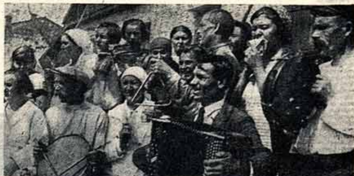
Самодельный звуковой аппарат изобретает школьник (Домбос, Степанов, ищет им, Каганович)