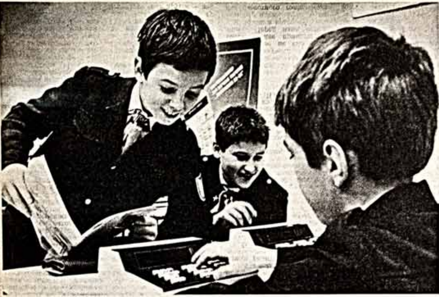
В Московском городском дворце пионеров и школьников в эти дни многолюднее обычного. Вы видите ребят, работающих с компьютерами в лаборатории информатики и вычислительной техники.