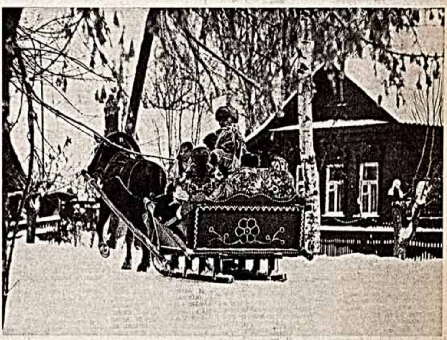
В сельский клуб на праздник!