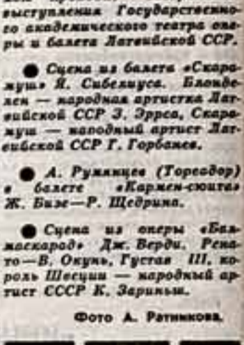
На сцене Большого театра Союза ССР в Большом зале выступила Государственная академическая театральная труппа Латвийской ССР.

Историкографическое издание «Историкографическое издание «Искусство».