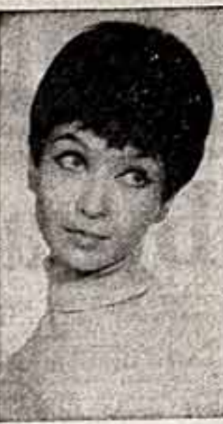
«МЭР ПАРТИИ» ФИЛЬМ-СПЕКТАКЛЬ МОСКОВСКОГО ТЕАТРА ИМЕНИ М. И. ГИМОНОВА — 25 АВГУСТА.

«Да, не у всех мамы столь доказательно мудры, как у той девушки из МВТУ. Впрочем, нет, еще одна родительница очень мне понравилась. Подошла ко мне очаровательная бабуся в синем кафтане. Конфузно сказала: — А свою внучку тоже привела. Да нет, она не годится — чертенькая и глазки зелененькие. — А почему вы в халате — вы здесь работаете? — Здесь, в бюро пропусков, — вздохнула, улыбаясь. — Красоту разве так ищут!