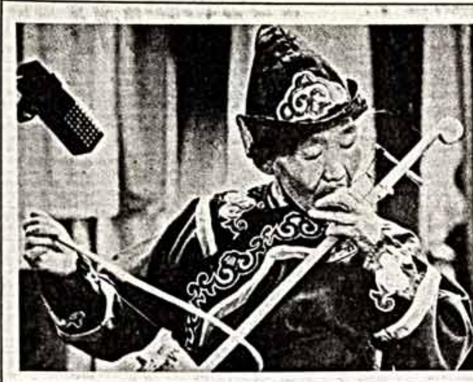
Большой популярностью в Омской области пользуется фольклорный ансамбль «Ли джене» («Большое соли чье»).

Никита БОГОСЛОВСКИЙ. Р. С. В нашей стране ежегодно выводится десятки (если не сотни) тысяч выгоров. Но, в сожалею, значительно реже встречается гораздо более действенная формулировка: «Ввиду несоответствия занимаемой...»