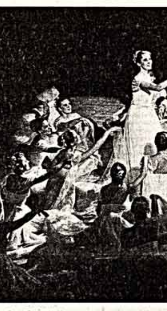
На сцене прославленный ансамбль «Вережа».

«Он — это мы». «Мы — это один народ, и бороться нам не с неведомым врагом, а с самим собой, с паразитическими «взращенками», которые нас превращают в энки». Сегодня «Птичий полет» М. Жванецкого идет в Театре эстрады. Постановка спектакля М. Розовский. Играет уникальный актерский дуэт: Роман Карцев и Виктор Ильченко.