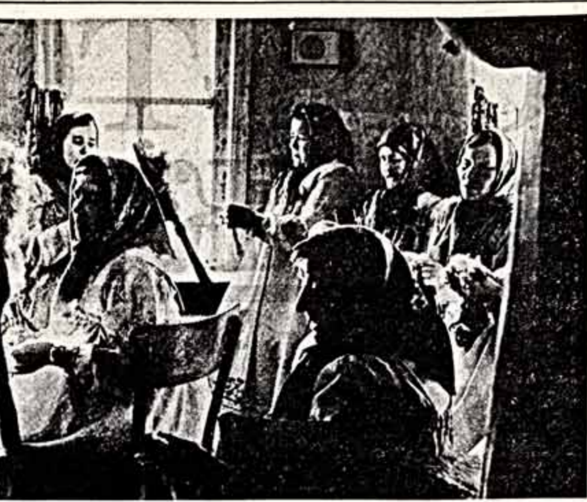
«В зорнице» — так назвали свою музыкальную коллекцию участники фольклорного ансамбля Чернышевского сельского дома культуры Тарского района Омской области.