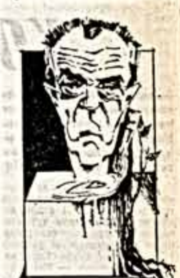
Б. Оуджин, В. Павлов, Рисунок К. Валова.