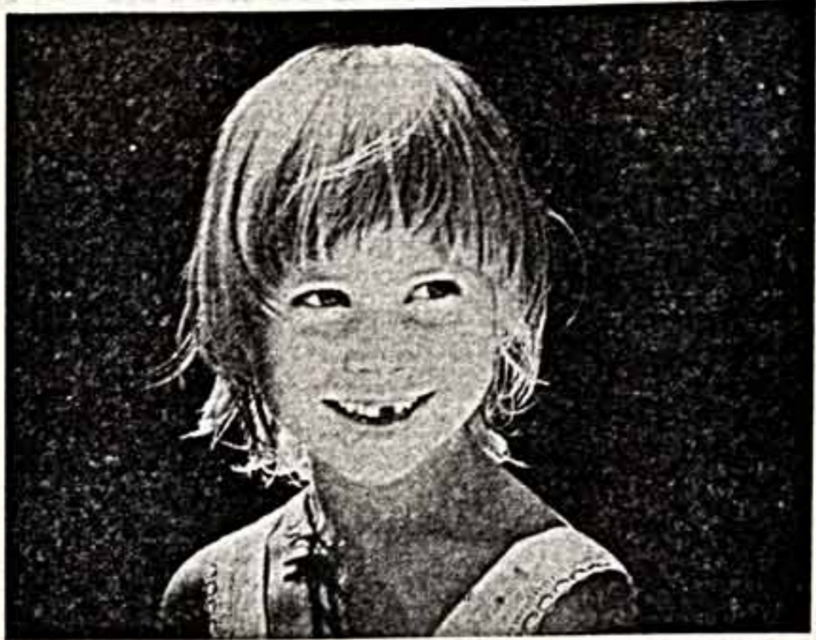
Снимки из серии «Девчонки-мальчишки»

Казанские фотографы. Так что не танец для известного артиста, предельно занятого в театре, фотограф!