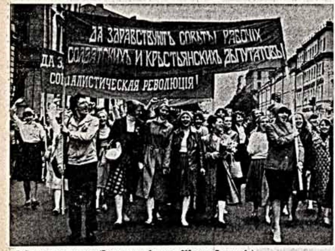
Первый заветный отцов. (Во время празднования 25-летия Ленинграда).