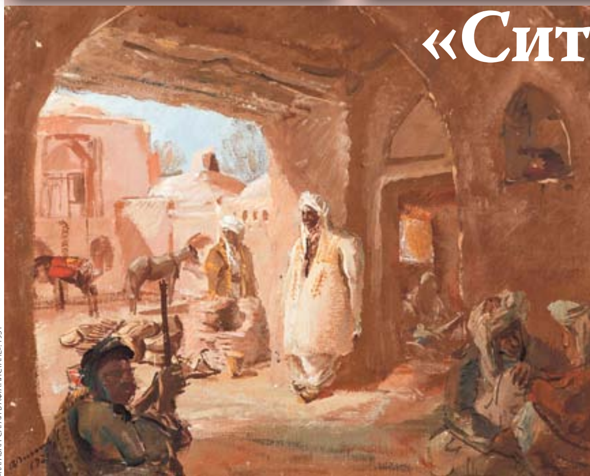
«КАРВАН-САРАЙ В АВАНИСТЕНЕ» 1931

В СТОЛИЧНОЙ галерее «Наши художники» представили проект «Александр Яковлев. Восток». Полтора года назад в этих стенах показывали рабо-