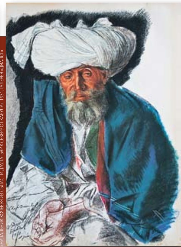
«НАЧАЛЬНИК КОМАНДЫ ИЗ ОБЛАСТИ ДАЛГАТЪЯР К СЕВЕРУ ОТ «КАВКАЗА»» 1931. ГАЛЕРЕЯ «ДИАЛОС»