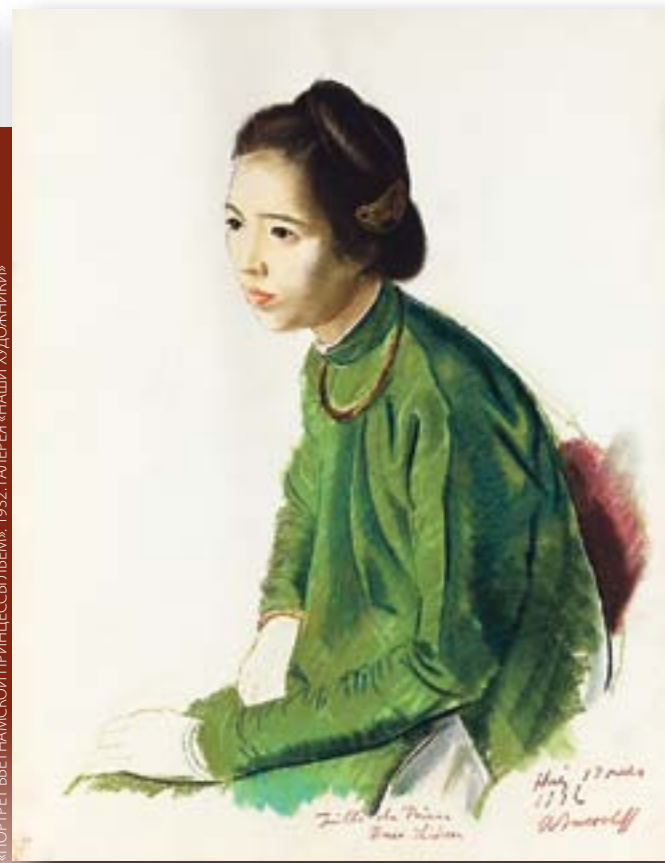
«ПОРТРЕТ ВЬЕТНАМСКОЙ ПРИНЦЕССЫ ЛЬЕМ» 1932. ГАЛЕРЕЯ НАШИ ХУДОЖНИКИ