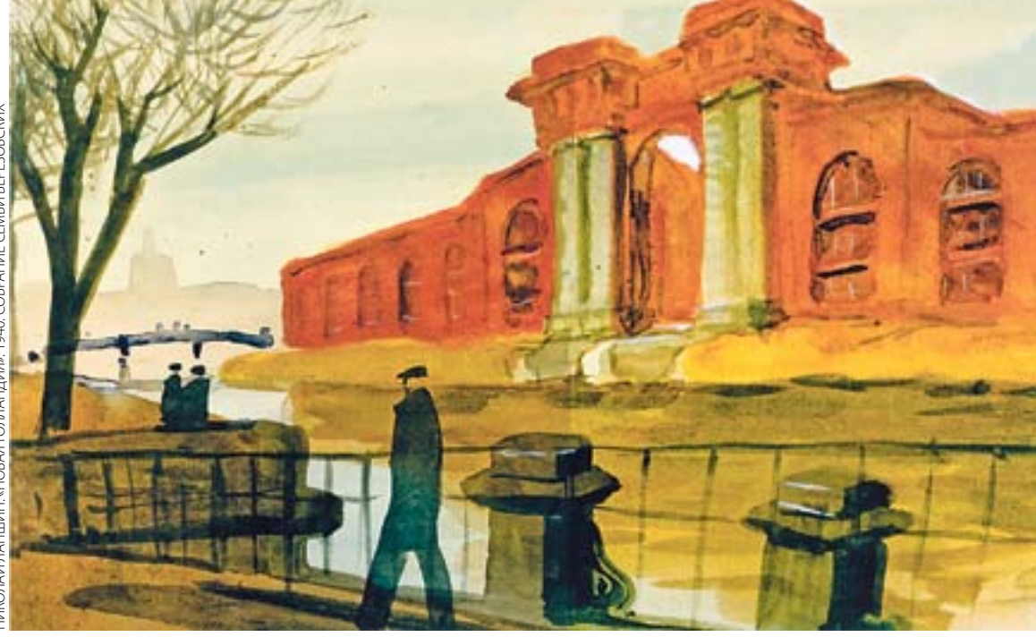
НИКОЛАЙ ПЛАШИН. «НОВАЯ ГОЛЛАНДИЯ» 1940. СОБРАНИЕ СЕМЬИ БЕРЕЗОВСКИХ