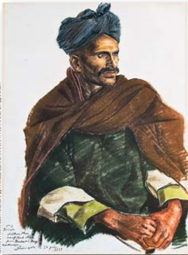
«СЛУПАН МИР БОИ» АЛЕКСАНДРА ЯКОВЛЕВА. СРИНАГАР, 1931. ГАЛЕРЕЯ «ДИАЛОС»