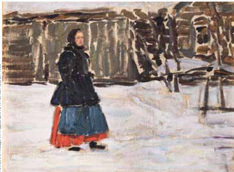
НИКОЛАЙ МЕЩЕРИН. «ДЕВУШКА В КРАСНОЙ ЮБКЕ», 1903