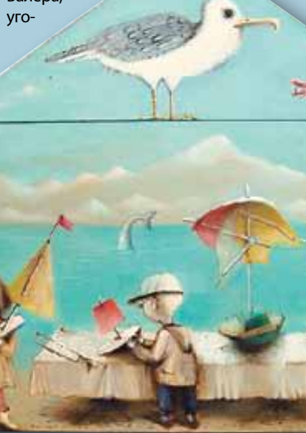
НАТАЛИЯ НЕСТЕРОВА. «ЛОЖКА», 2004