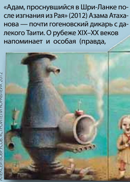
АЛЕКСЕЙ БОБРОВ. «СТРОИТЕЛИ КОРАБЛЕЙ», 2012

Сон — своеобразное зазеркалье, возможность заглянуть в потусторонний мир. В мифах онейрическое состояние нередко рассматривается как метафора смерти. Так, Мила Маркелова изображает душу девушки, словно покинувшую тело: «Летаргия» (2011) — отход от бытовой тематики, близкой художнице, к сторону мистического, ирреального. С «миром горным» соприкасаются работы, насыщенные мотивами Эдемского сада.