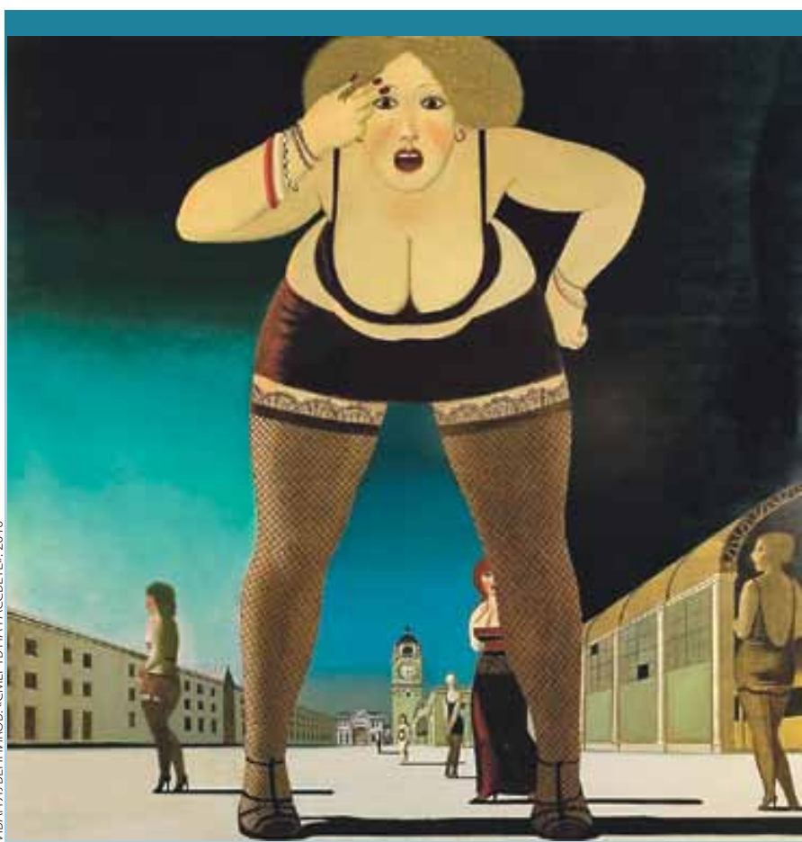
ИВАН ЛУБЧЕНКОВ. «СМЕРТЬ НА РАССВЕТЕ», 2010