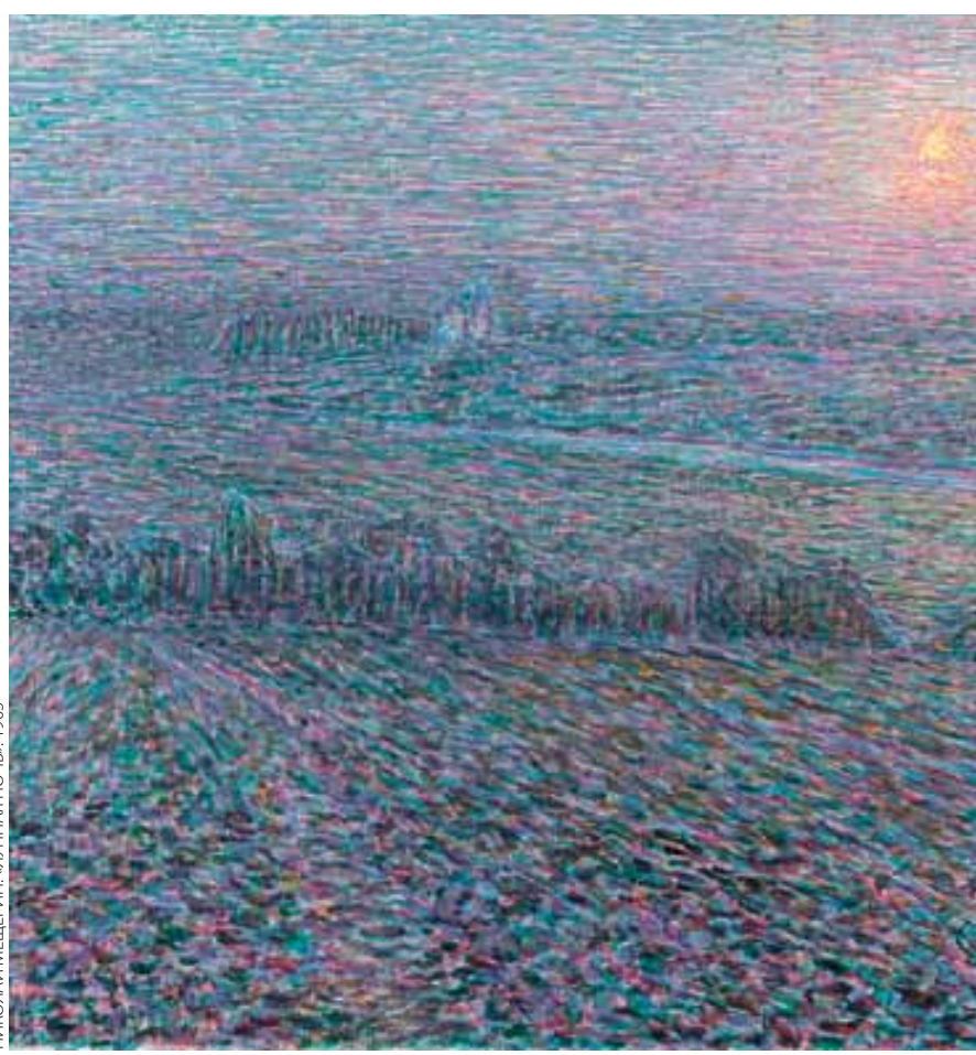
НИКОЛАЙ МЕЩЕРИН. «ЛУННАЯ НОЧЬ», 1905