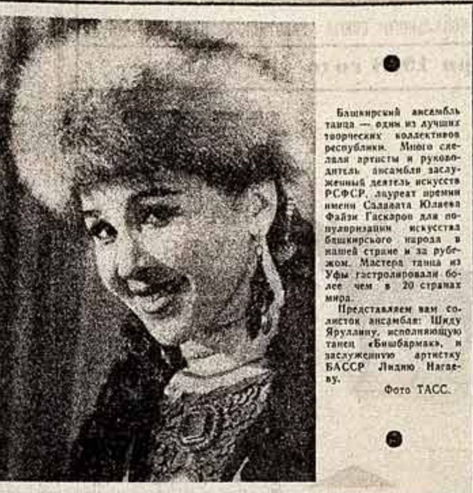
Башкирский ансамбль танца — один из лучших творческих коллективов республик. Много сделала артистка и руководитель ансамбля заслуженный деятель искусств РСФСР...