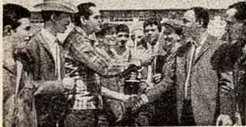
Группа мастеров искусств Республики Грузия на Азербайджанском трибунальном заводе имени В. И. Ленина в Сумгаите.

Творческие работники Грузии с чувством глубокого сознания почетных задач, стоящих перед ними, готовятся к столетию со дня рождения В. И. Ленина.