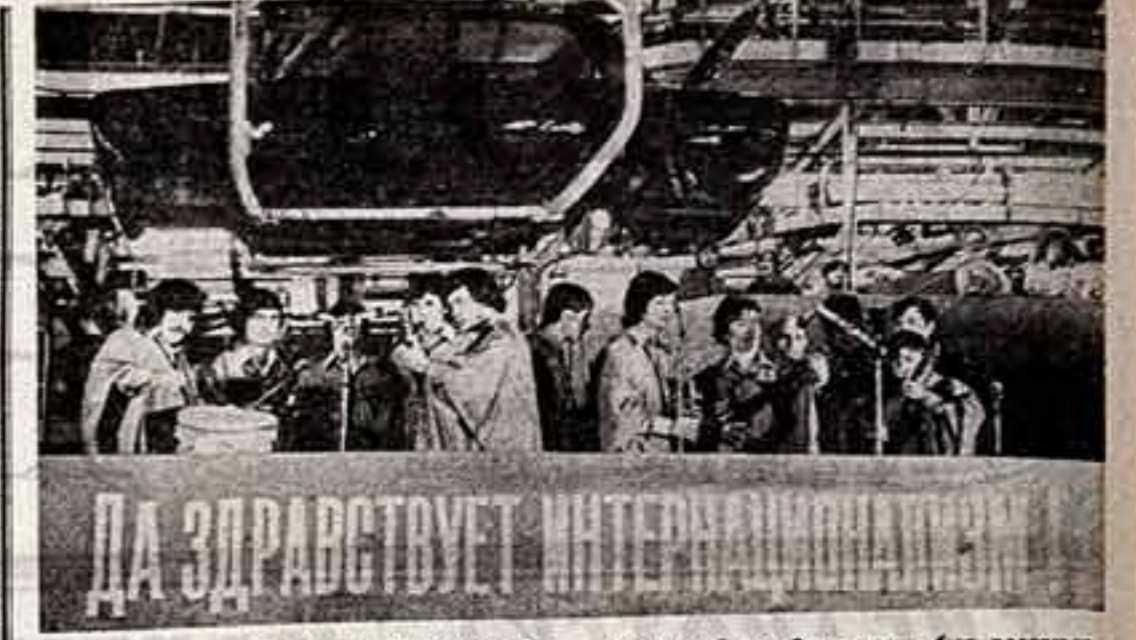
В Тольятти — городе волжских автомобилей, тракторов и комбайнов — состоялся шестой фестиваль политической песни памяти чл. ЦК КПСР Виктора Хары, побывшего от рук фашистского хунты. Форум молодых интернационалистов собрал около четырехсот юношей и девушек из многих стран мира.

Выполнение этих задач, подчеркнул многие из выступавших, требует от кинематографистов терпеливости и идейным просчетом и художественному браку в киноискусстве, проведенная творческих диску-