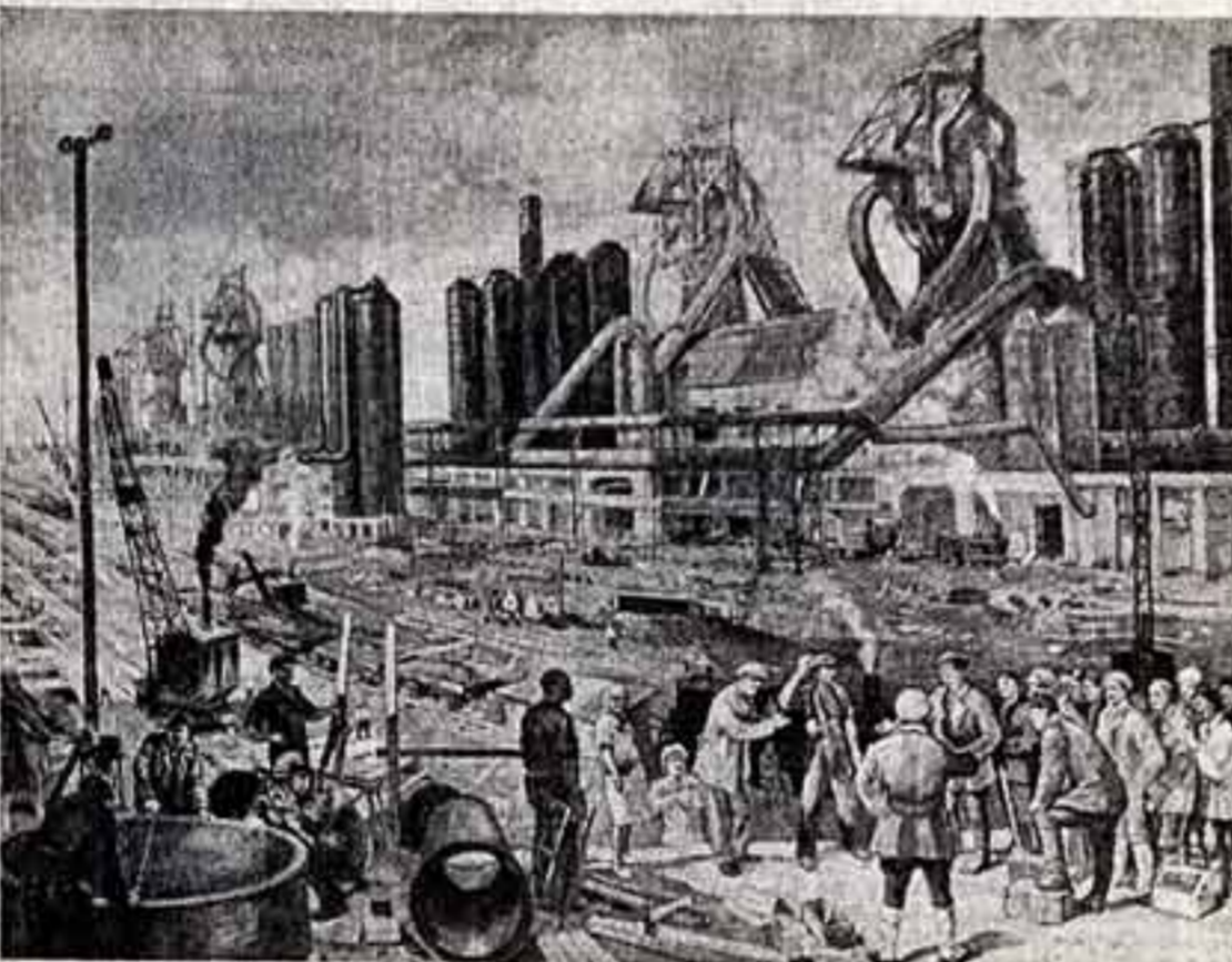
Е. ЛЬВОВ. «Магнитогорский металлургический завод, 1933 г.»