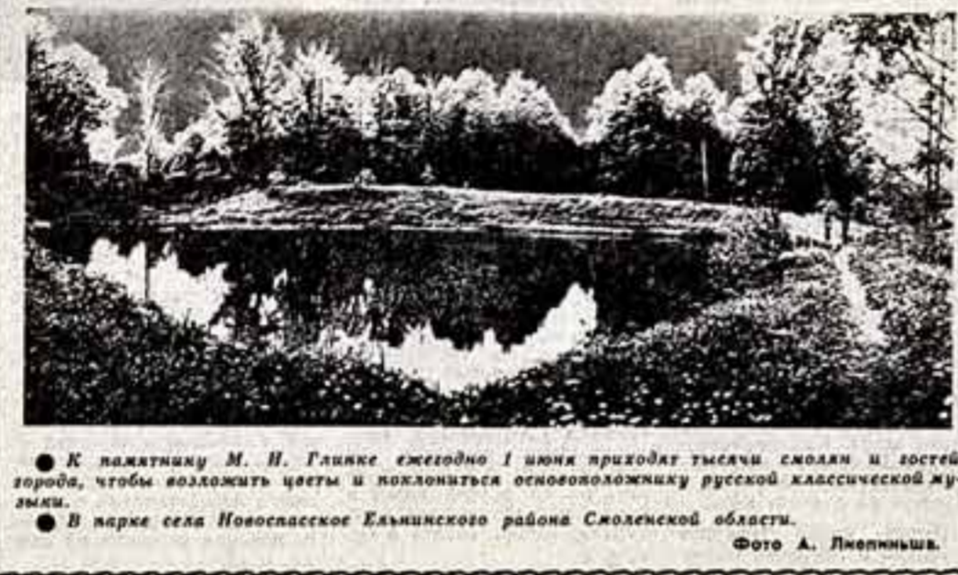
К памятнику М. И. Глинке ежегодно 1 июня приходит тысячи людей и гостей города, чтобы возложить цветы и поклониться основоположнику русской классической музыки.

«В парке села Новоспасское Ельнинского района Смоленской области». В среднем каждый десятый житель района — член любительского коллектива. А во время «вторую» год идут и готовятся все кругом и обходятся (их здесь около 400) начинают борьбу за право выступать на глинкавской неделе. Подобный конкурс проводится в среде учащихся... Все это сегодняшней музыкальной мир родины композитора — героической Смоленской земли, любительств, может быть, подчас и не обязанных по долговости делать то, что они делают, но чувствующим сознательный пульс времени и по призыву сердца и сочувствием влюбленным воспитателям развивающихся, возмужавшим народных традиций русского музыкального искусства.