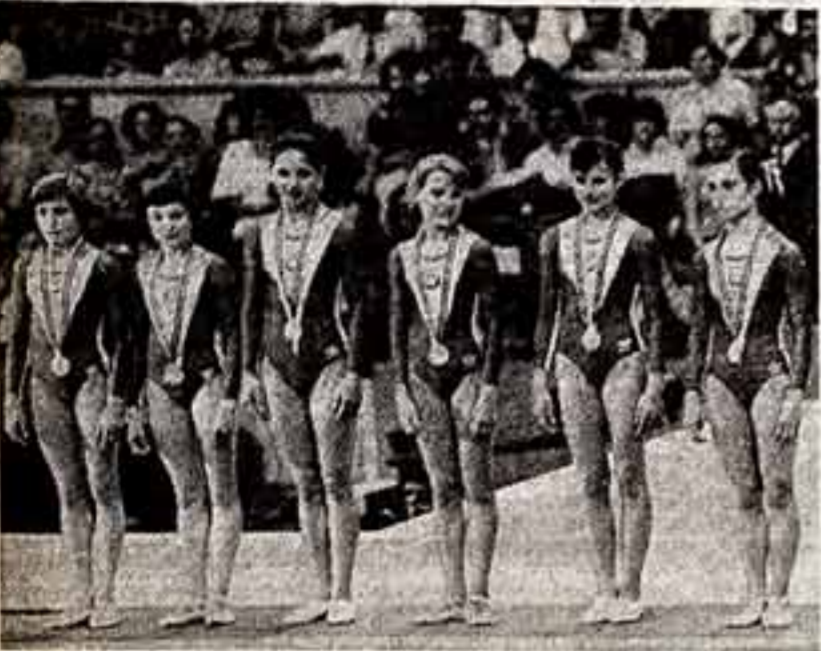
Женская сборная команда СССР по гимнастике — олимпийский чемпион.