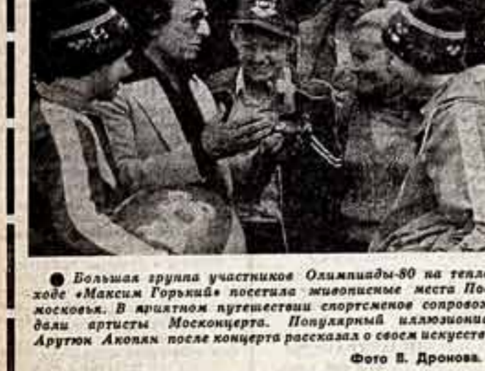
Большая группа участников Олимпиады-80 на теплоходе «Максим Горький» посетила живописные места Подмосковья.

Пульс Олимпиады — отличный! М. ТОРЧИНСКИЙ.