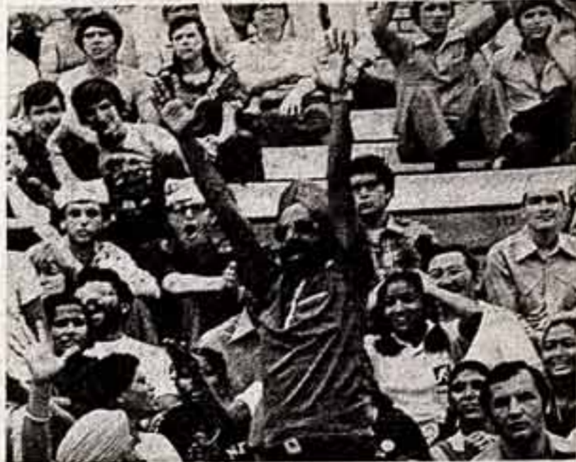
На трибунах — болельщики из зарубежных стран.

ПРЕМЬЕРЫ ТЕЛЕВИЗИОННОЙ НЕДЕЛИ С 28 ИЮЛЯ ПО 3 АВГУСТА