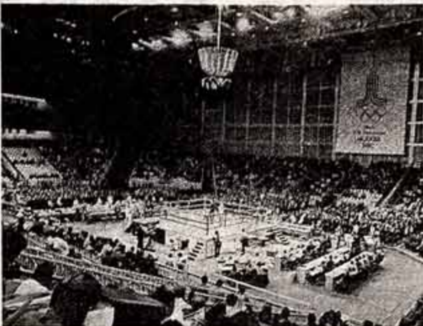
На стадионе «Олимпийский» проходят соревнования по боксу.