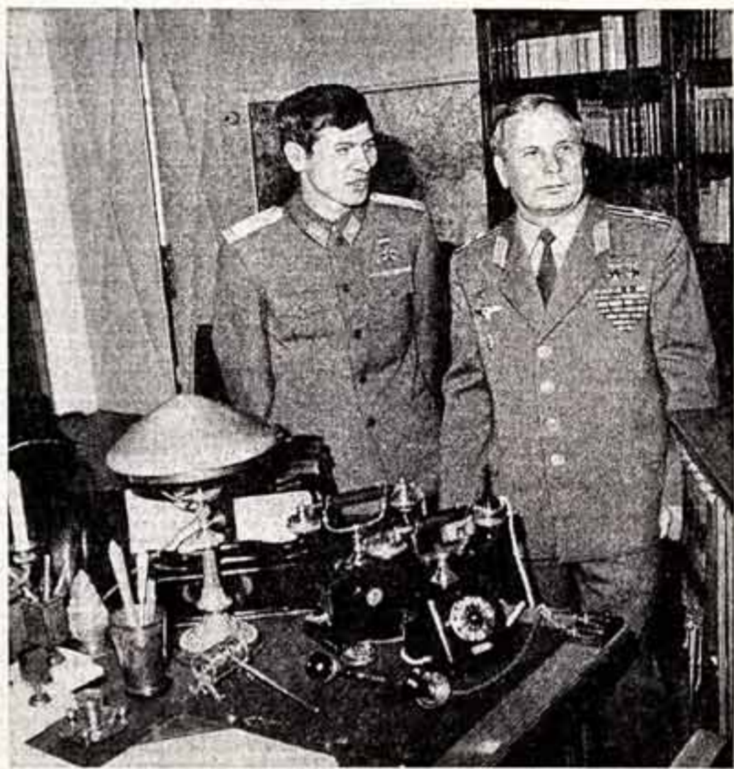
Международный экипаж космического корабля «Союз-37» во время посещения кабинета в квартире В. И. Ленина в Кремле.

23 июля 1980 года в 21 час 33 минуты московского времени в Советском Союзе осуществлен запуск космического корабля «Союз-37». Космический корабль пилотирует международный экипаж: командир корабля дважды Герой Советского Союза, латыш-космонавт СССР Виктор Горбатко и космонавт-исследователь Герой Социалистической Республики Вьетнам Фам Туан. Программой полета корабля «Союз-37» предусматриваются стыковка с орбитальным комплексом «Салют-6» — «Союз-36» и проведение на его борту исследований и экспериментов совместно с космонавтами Поповым и Ромниным. В ходе полета корабля «Союз-37» будут про-