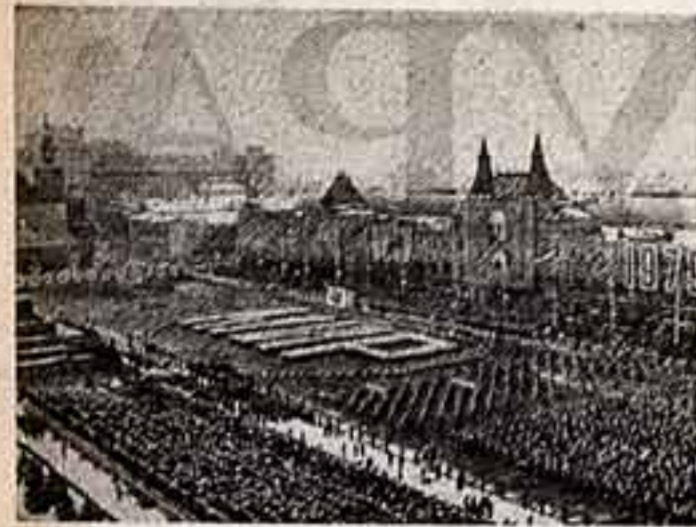
Москва. Участники манифестации выстроили на Красной площади священное и яркое слово, дорожное всем людям планеты. — «Мир».