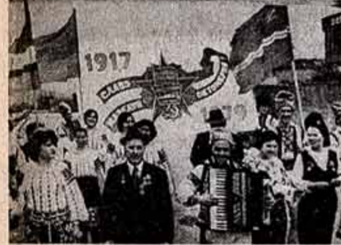
Молдавская ССР. Народные гулянья в селе Кожумья Страшенского района 7 ноября 1979 года.