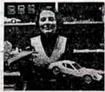
Производственное объединение «Связь» Министерства промышленности СССР является одним из крупнейших предприятий в республике по производству игрушек. Кроме того, объединение выпускает электронные фотомультипликационные лампы и хозяйственные изделия — желатинные «сувениры» из Таллина. Делают любой заказ. Большой популярностью пользуются разнообразные значки — одною десятку миллионов штук в год.