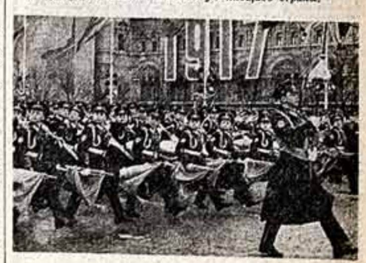
На праздничном марше — юные музыканты.