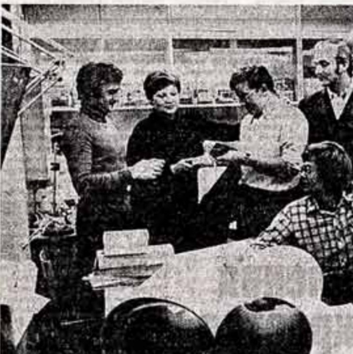
Технолог объединения А. Сельмаз демонстрирует новые образцы игрушки.