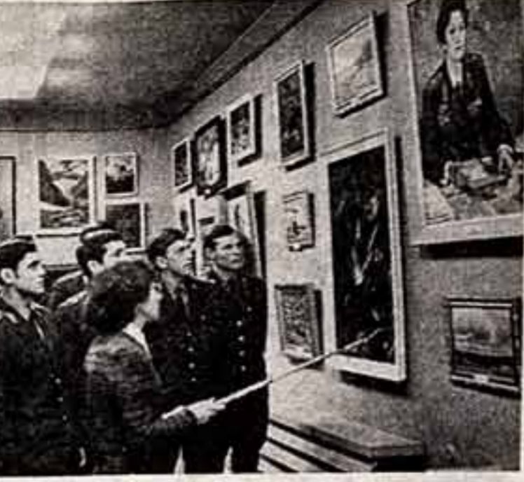
Дни и ночи несут свою вахту по охране социалистического правопорядка сотрудники советской милиции...