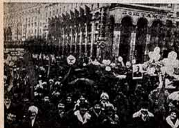
Киев. Празднование 62-й годовщины Великой Октябрьской социалистической революции в столице Украины.