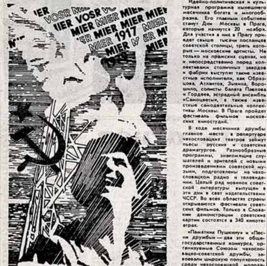
Идеально-политическая и культурная программа нынешнего месячника богата и многообразна.

Польша Красными революционными знаменами советскими и бело-черными государственными флагами ГПР города и села нарядной Польша расцветила октябрьские 42-й годовщины Великой Октябрьской социалистической революции.