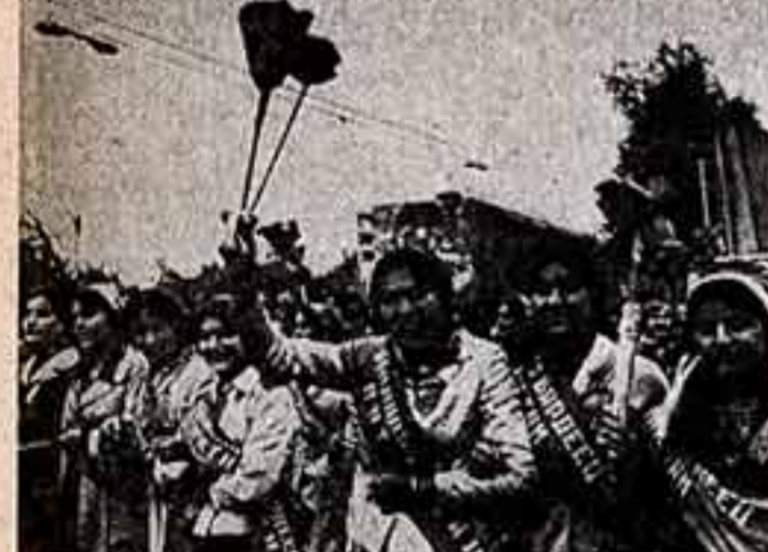
Душанбе. В праздничной демонстрации передовики производства солнечного Таджикистана.