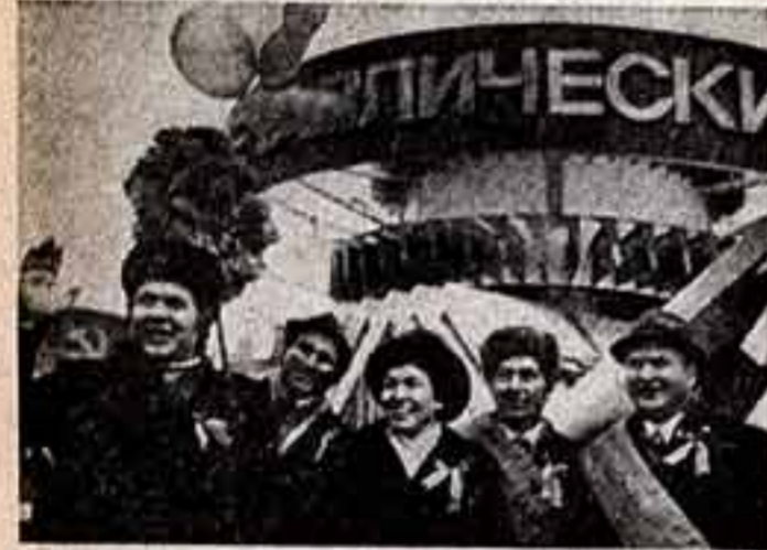
Ленинград. В колонне демонстрантов передовые турбостроители объединили «Ленинградский Металлический завод».