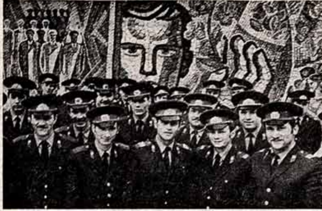
Дни и ночи несут свою вахту по охране социалистического правопорядка сотрудники советской милиции...

сотрудник пресс-центра Министерства бытового обслуживания населения РСФСР. Москва.