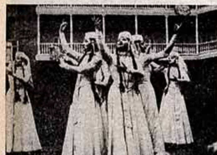
Тбилиси. Участники художественной самодеятельности во время народного гулянья в честь 62-й годовщины Великой Октябрьской революции.