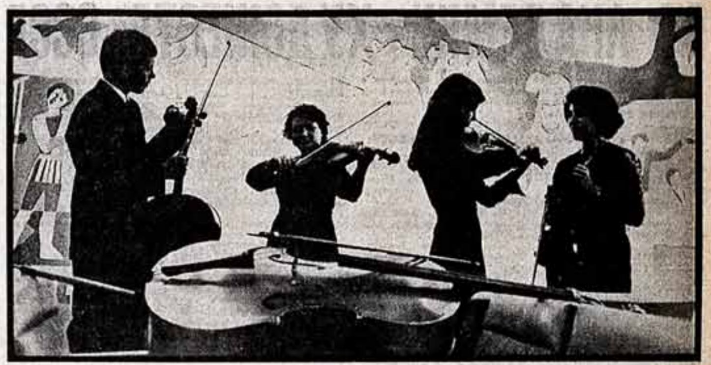
Алма-Атинское музыкальное училище им. П. И. Чайковского, основанное в 1922 году, подготовило немало профессионально музыкальному образованию в Казахстане. За четыре с лишним десятилетия из его стен вышли сотни специалистов, многие из которых стали профессиональными мастерами искусства.