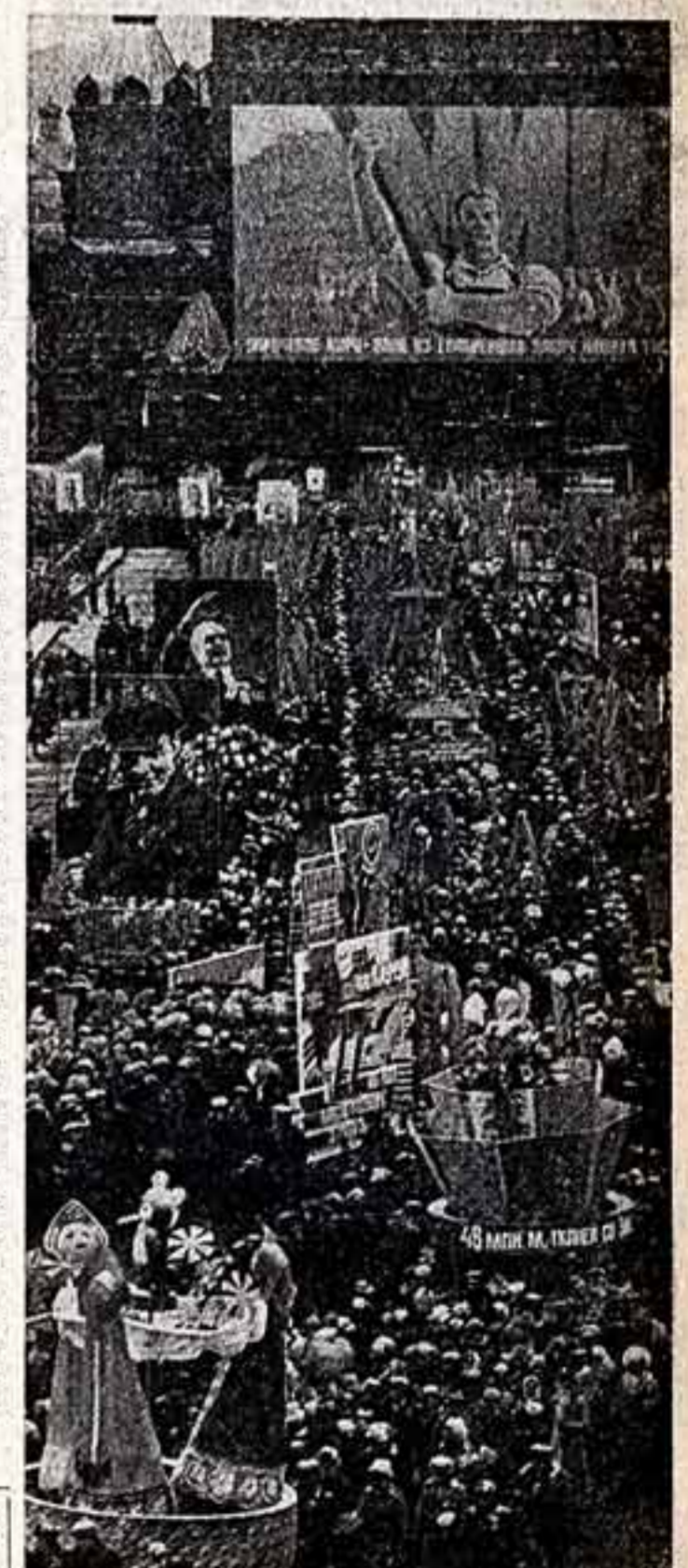
Демонстранты заполнили главную площадь страны.