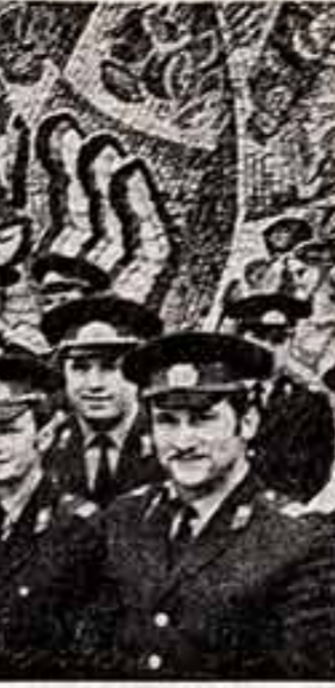
Дни и ночи несут свою вахту по охране социалистического правопорядка сотрудники советской милиции...