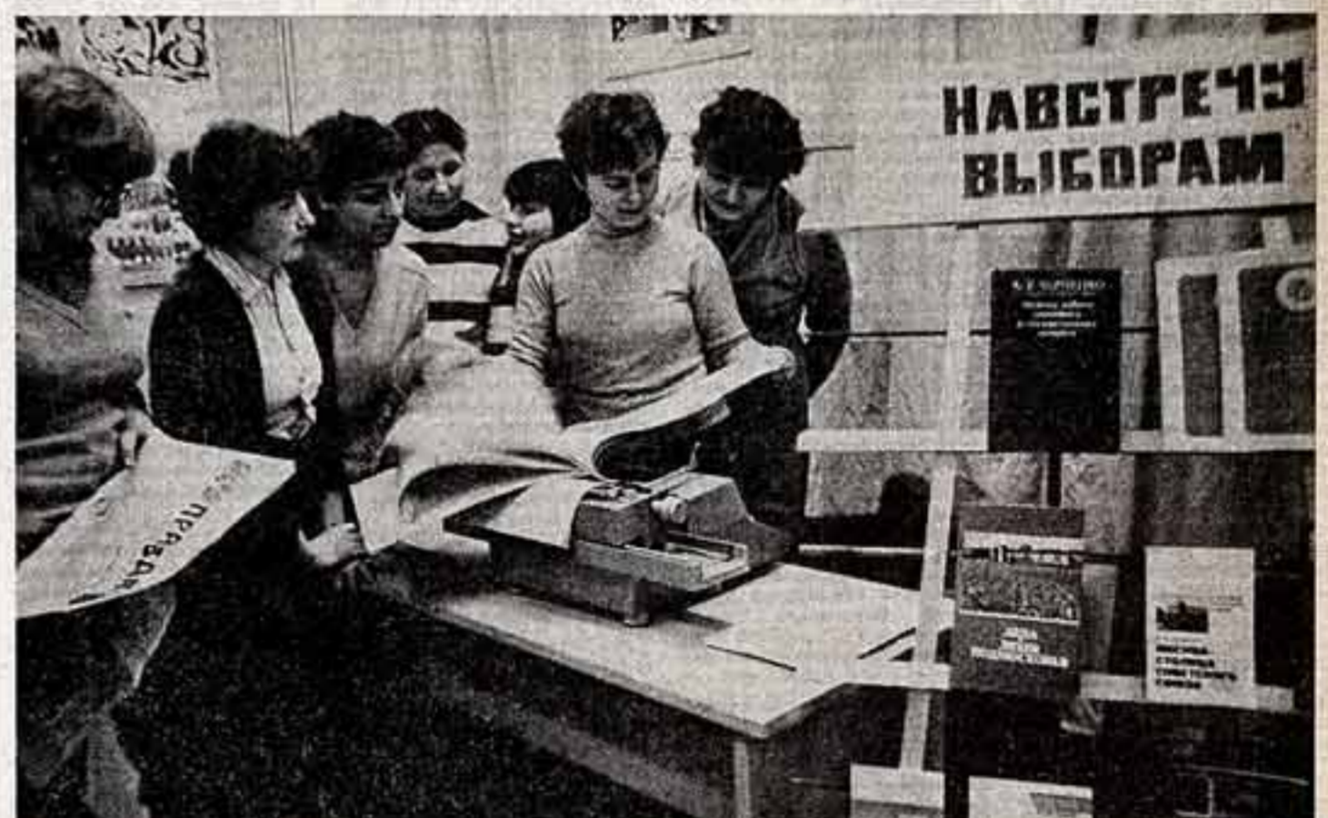
В конце рабочего дня аспиранты оживили агитпункт. Избирательная кампания по выборам в Верховные Советы союзных республик вступает в свой заключительный этап, и агитаторы сейчас особенно много работают. Уточняются списки избирателей. Людям, пришедшим на агитпункт, должны получить квалифицированный ответ на все интересующие вопросы.

Учительница средней школы № 754 города Москвы