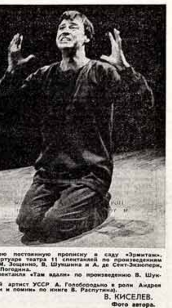
В. КИСЕЛЕВ. Фото автора.