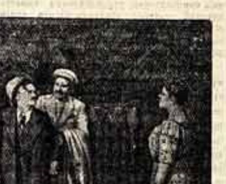
Сцена из спектакля «Печать доверия».

Итак, пьеса ли то, что выпал Архангельский? Да, несомненно. Хотя бесспорно и то, что автору нехватает профессионального умения, мастерства. Может ли его произведение служить материалом для сцены? Да, может. И пример тому — спектакль Тамбовского театра.