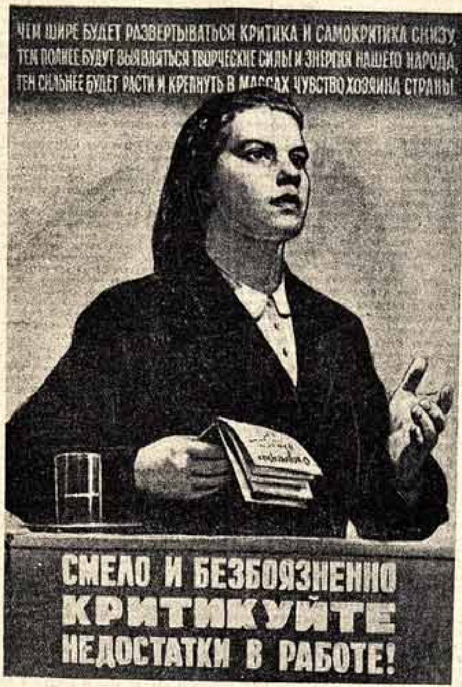
Плакат работы художника В. Иванова.