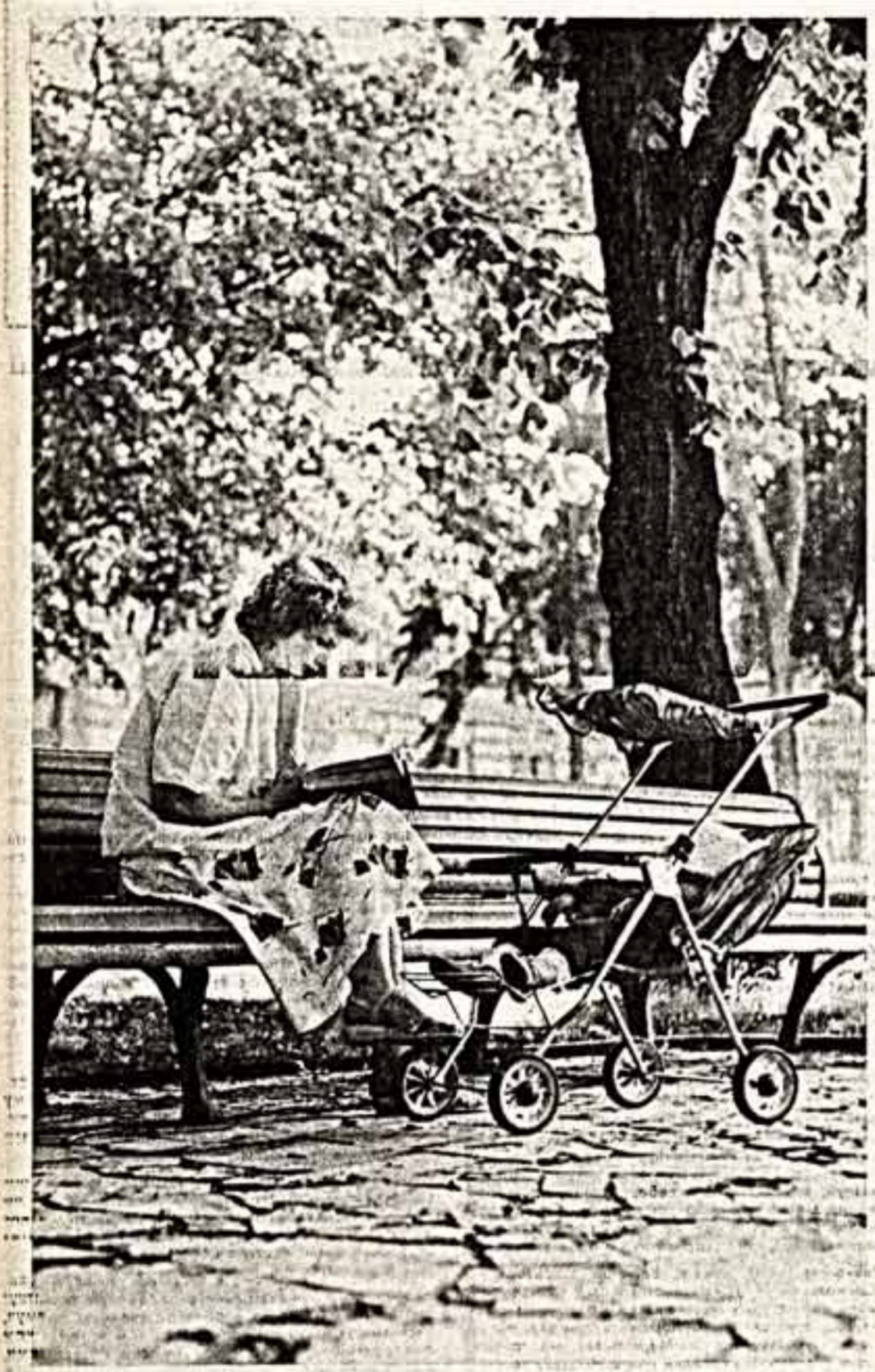
Л. ГЛАНДСКИЙ, член фотоклуба «Подиала», город Хмельницкий. «Мама готовится к выезду».