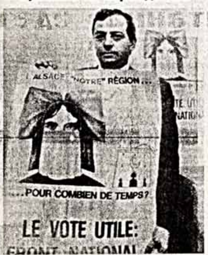
«POUR COMBIEN DE TEMPS? LE VOTE UTILE: FRONT NATIONAL»