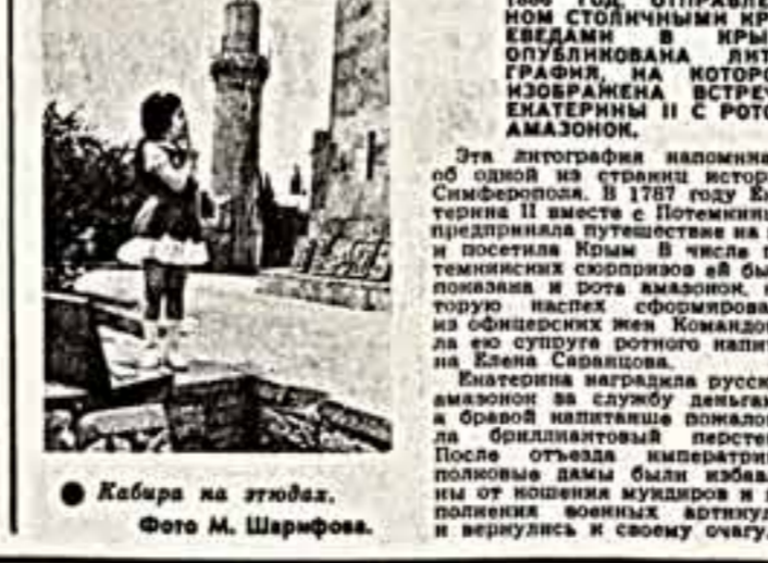
Кабра на угодях.

САМОЯ ЮНОЯ ХУДОЖНИЦА АЗЕРБАЙДЖАНА — ВАНИНЕ КАВРЕ ДЛИНЕВОЙ НЕДАВНО ИСПОЛНИЛОСЬ ШЕСТЬ ЛЕТ.