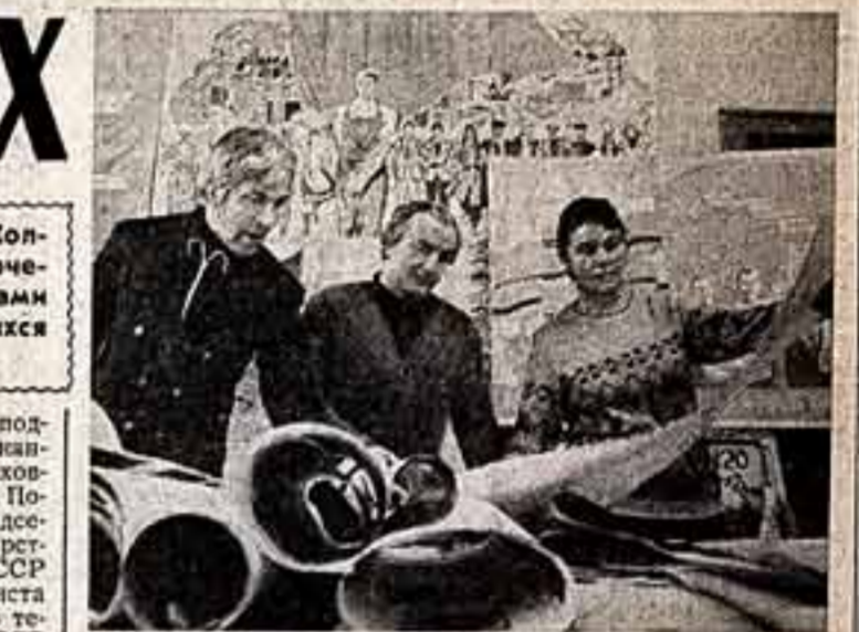
К выборам в Верховный Совет СССР издательство ЦК КПСС «Плакаты» выпускает 73 наименования различных видов плакатной агитации общим тиражом 18,5 миллиона экземпляров.