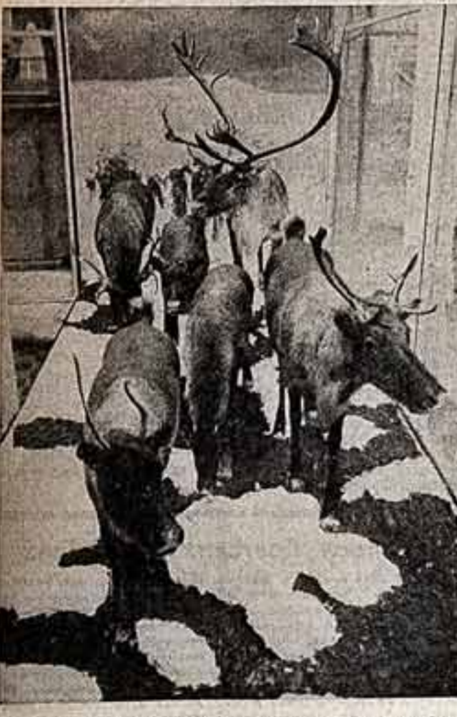
Новая экспозиция музея — животный мир в районе БАМа.