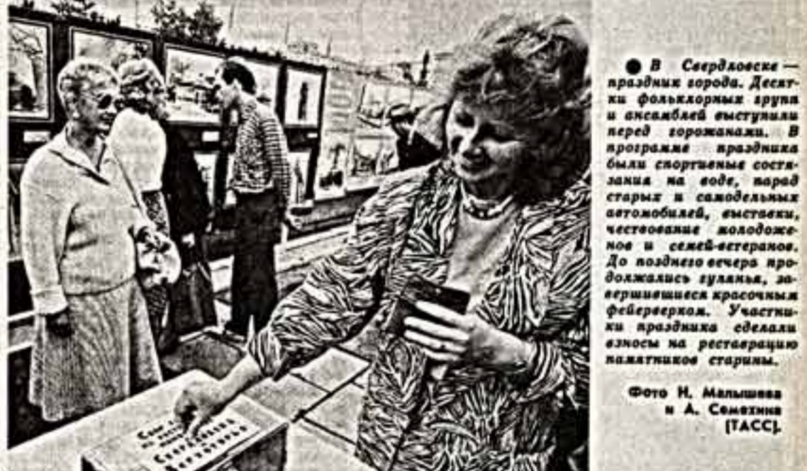
В Свердловске — праздник города. Детские фольклорные группы и ансамбли выступили перед горожанами. В программе праздника были спортивные состязания на воде, парад старей и самодельных автомобилей, выставки, чествование молодоженов и семей-ветеранов.

Симпозиум по скульптуре в камне состоялся в городе Подольске Московской области. В течение двух месяцев горожане могли наблюдать за работой скульпторов над своими произведениями в граните и мраморе, понять специфику их творческой работы.