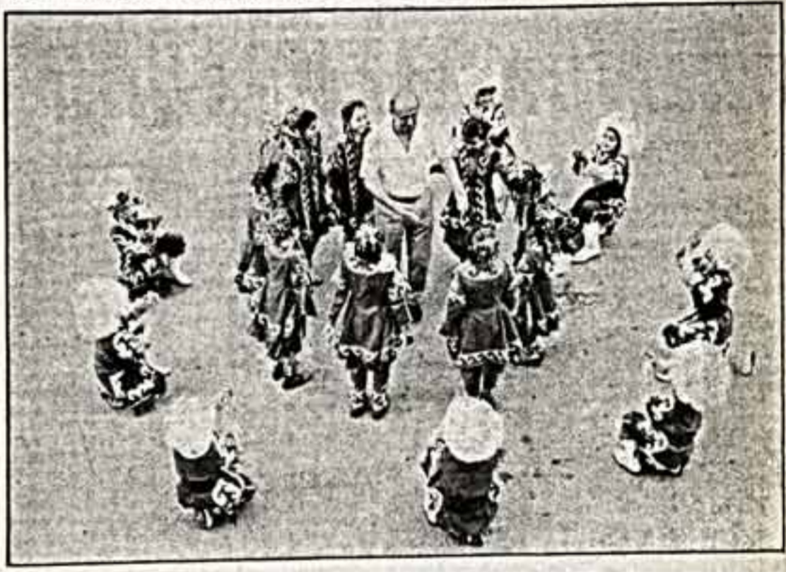
На Камчатке поддерживается и развивается самобытная национальная культура малых народов, издревле населяющих берега полуострова...