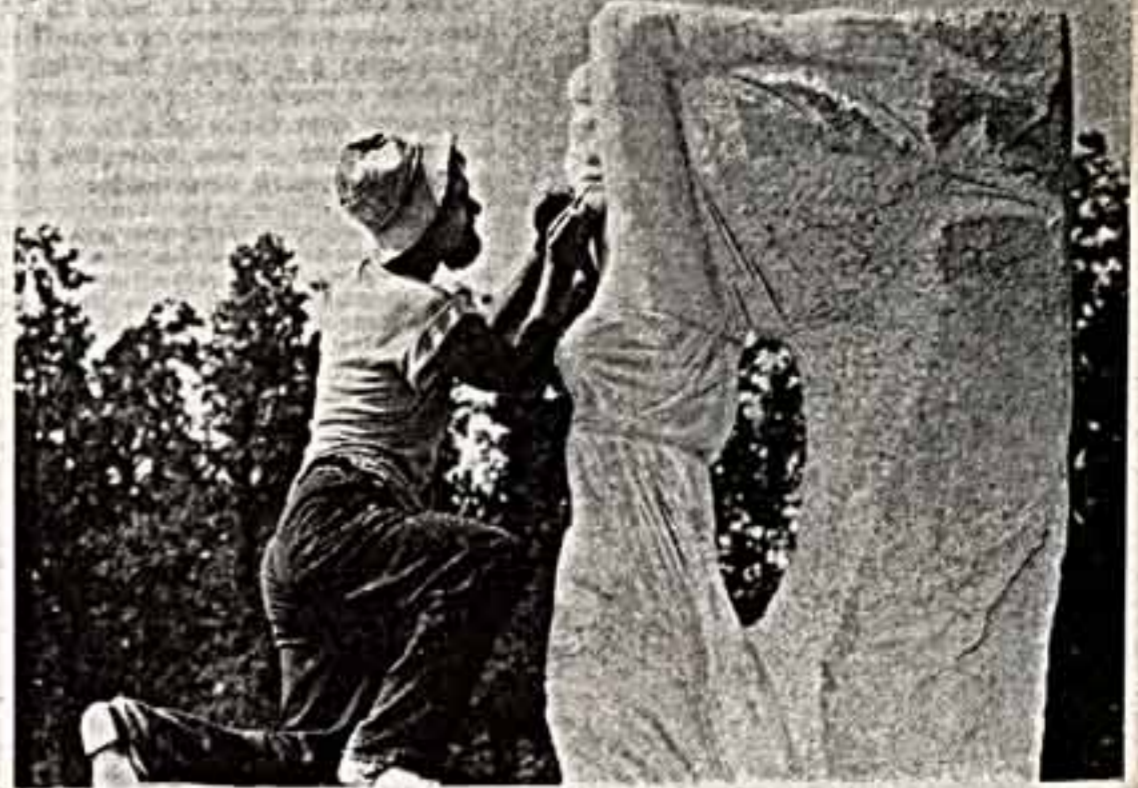
Симпозиум по скульптуре в камне состоялся в городе Подольске Московской области. В течение двух месяцев горожане могли наблюдать за работой скульпторов над своими произведениями в граните и мраморе, понять специфику их творческой работы.

Вот он, секрет биополя: мироощущение одного человека может не совпасть или не до конца совпасть с мироощущением другого, но каким счастьем становится долгожданное совпадение! А если оно не возникает, каждое общение означает ступеньку, веху на пути к общему, единому.