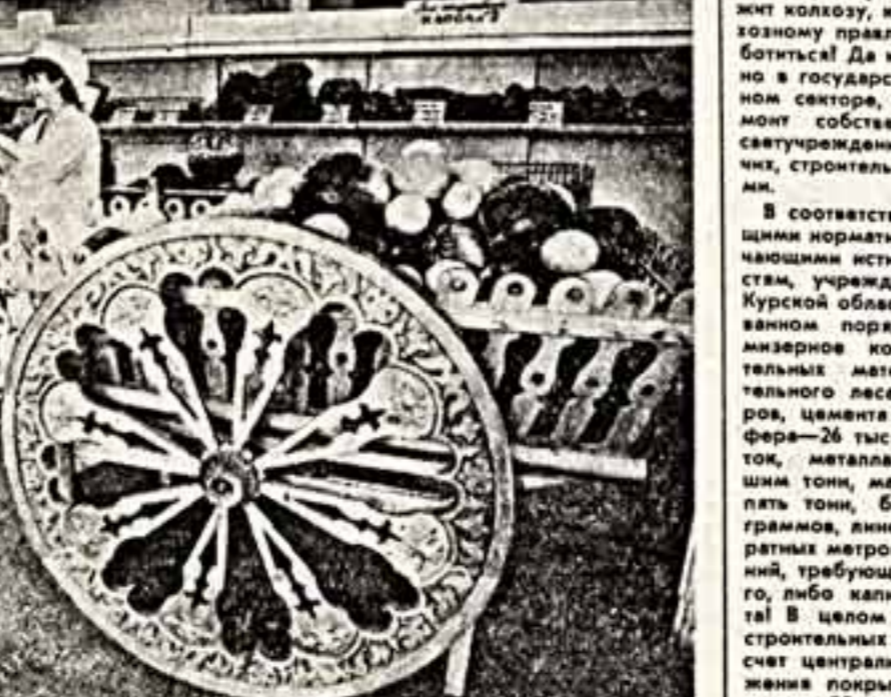
В Алаш-Ате открыт новый магазин «Дархан». Он привлекает выкладкой продукции и со вкусом оформленным интерьером.