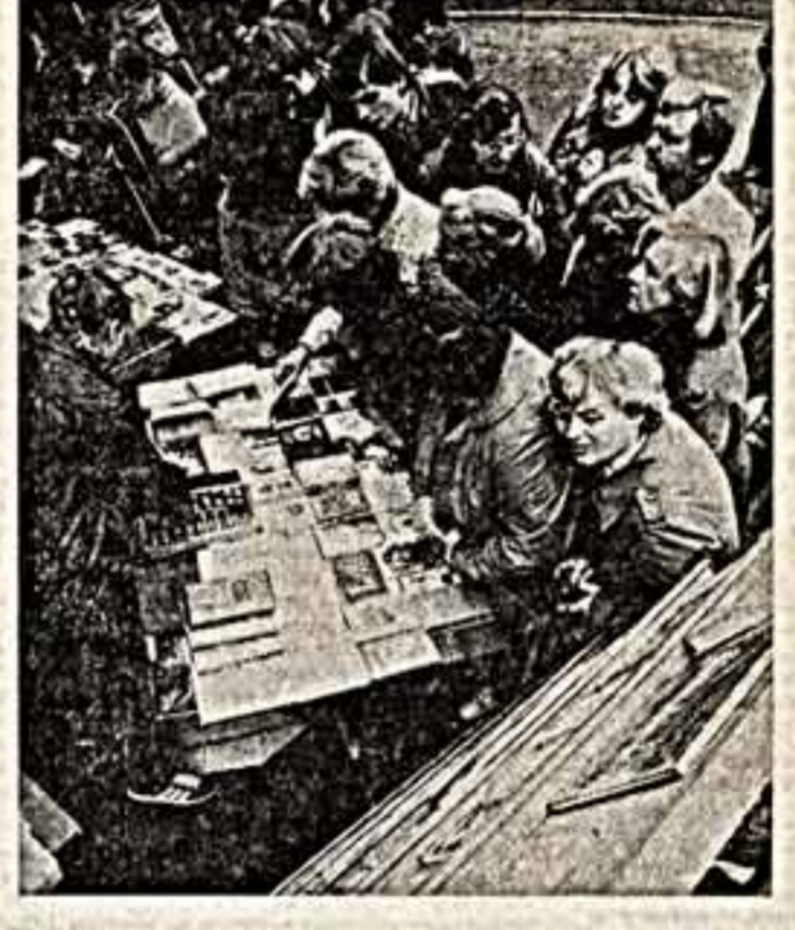
В Латвии прошли Дни поэзии. Их празднование неразрывно связано с именем поэта народного поэта республики Яна Райниса, которому в этом году исполнилось 120 лет со дня его рождения.