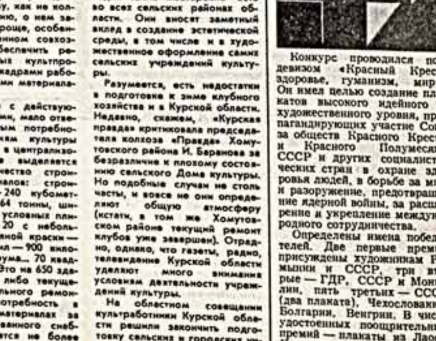
Конкурс проводился под девизом «Красный Крест: здоровье, гуманизм, мир».