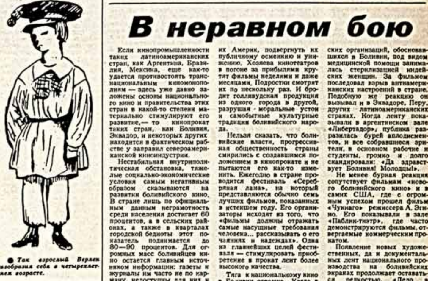
Так взрослая Верлен изображала себя в четырелетнем возрасте.

Тридцать стихотворений войдут в томик стихов, который готовится к изданию в Париже. В основном это никогда не публиковались сочинения. Их автор, известный французский поэт Поль Верлен, написал их в изгнании, в Бельгии, куда он уехал вместе с Артуром Рембо после кровавой недели в Париже, опасаясь мести за то, что служил в бюро печати Парижской Коммуны. Сообщая об этом читателям, западная пресса публикует также рисунки поэта.