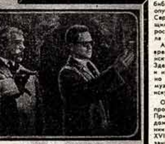
«ПЕРСТЕНЬ С РУСАЛКОЙ»