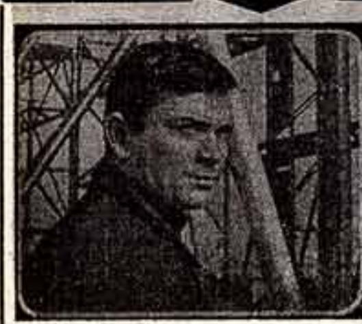
«ЧЕЛОВЕК БРОСАЕТ ЯКОРЬ»