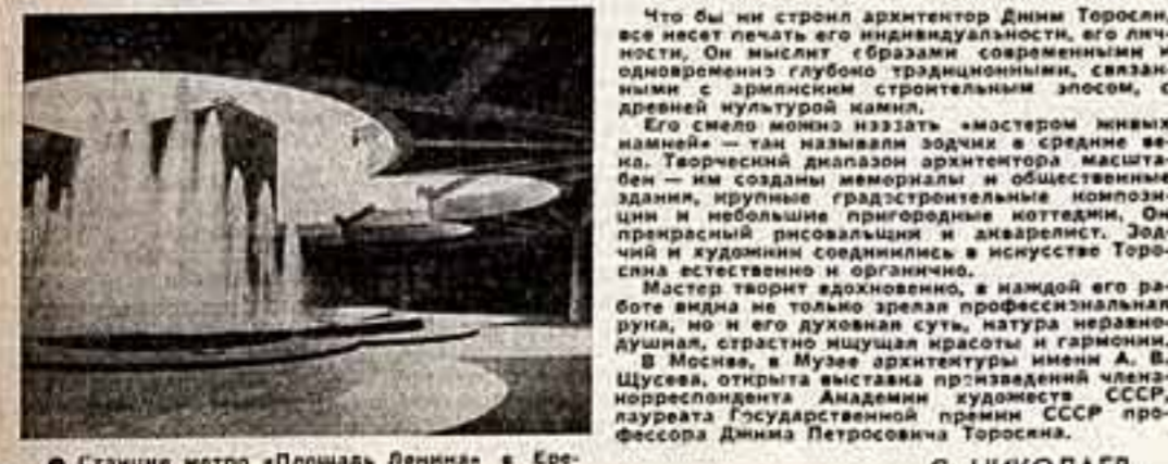
Станция метро «Площадь Ленина» в Ереване. С. НИКОЛАЕВ.