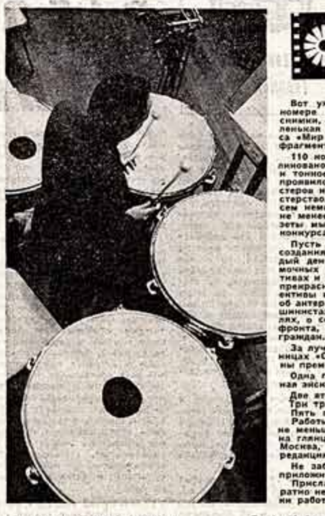
Ю. Набогов. «Юные саржонисты».

«В статье поднимается, на мой взгляд, очень актуальный вопрос — создания певически-читательского отличия, некоторые из них мы сегодня публикуем».