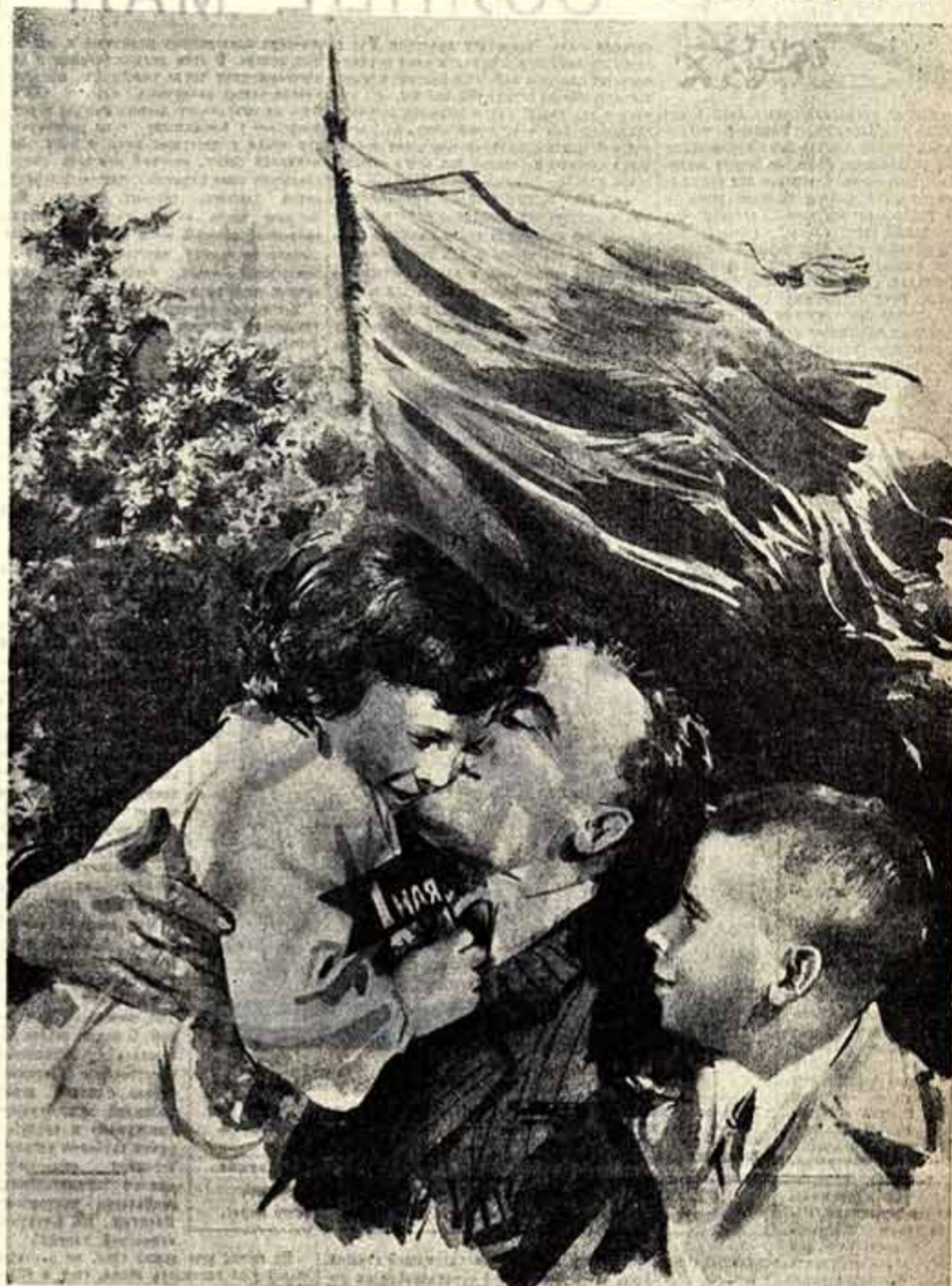
Рисунок В. Кляшников.