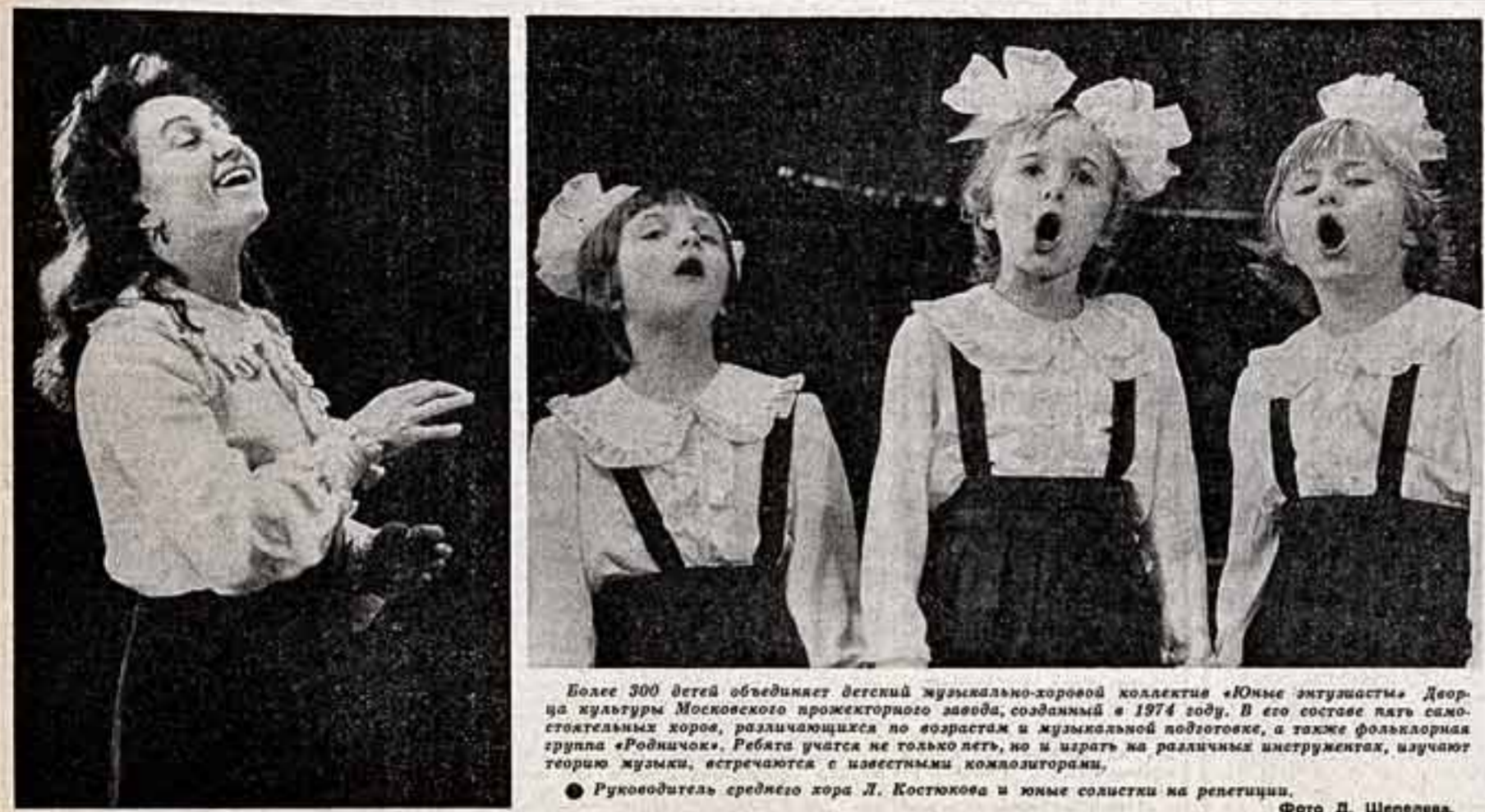
Более 300 детей объединил детский музыкально-хоровой коллектив «Юные энтузиасты»...