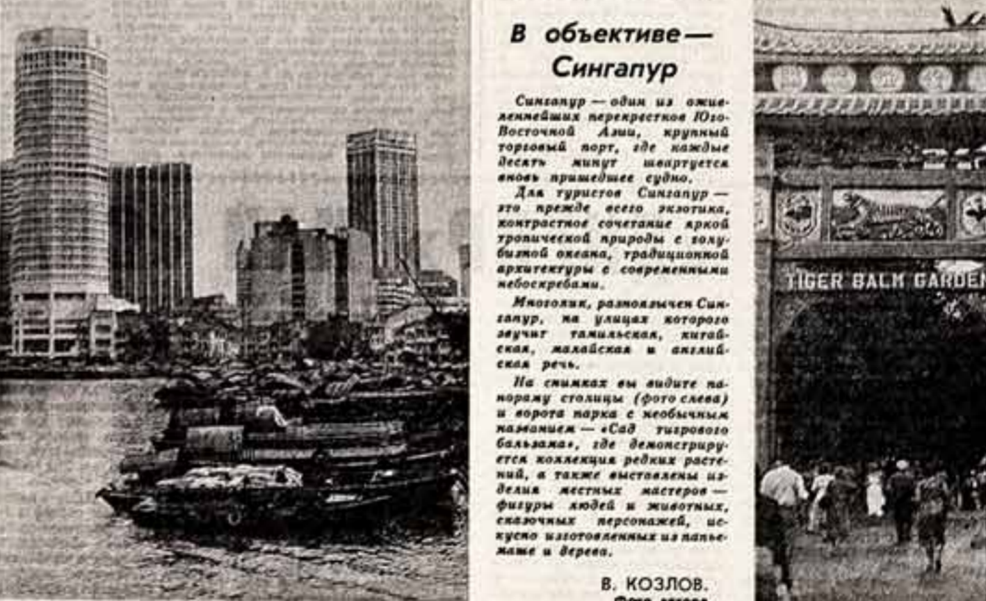
по странам мира В объективе — Сингапур

В. БОРОВСКИЙ, корр. ТАСС — специально для «Советской культуры», БРЮССЕЛЬ