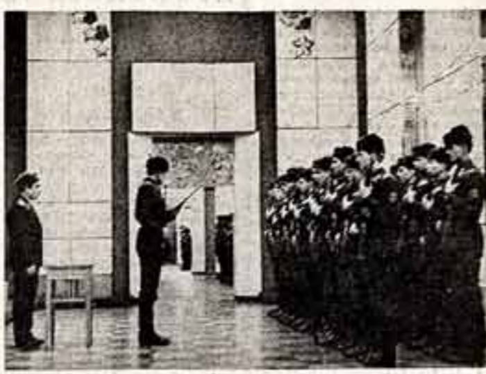
В музее прикипят-присыкут

«В 1943 году мощь партизанского движения, — говорит он, — его массовость и тактическая зрелость возросли настолько, что Центральная и Белорусская штабы партизанского движения выдвинули общедвиж план разгрома железнодорожных коммуникаций врага.