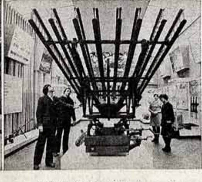
В одном из залов музея.