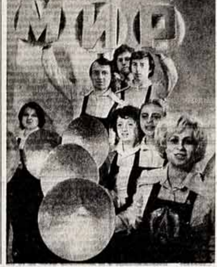
Зорцы культуры «Открытие» ардена Трудового Красного Знамени завода «Автоматик» в Константиновке Донецкой области была открыта в связи 60-летия Советской власти.

Здесь артельный зал на 1.200 мест, выделенный зал на 400 мест, более 30 кабинетов для кружковой работы, спортивный комплекс. Театр во Дворце работает танцевальной и драматической коллективом, академический хор и молодежный хор революционной песни, ансамбли и вокально-инструментальные ансамбли. Функционирует также клуб любителей музыки, филателистический клуб, любительский природный университет культуры.