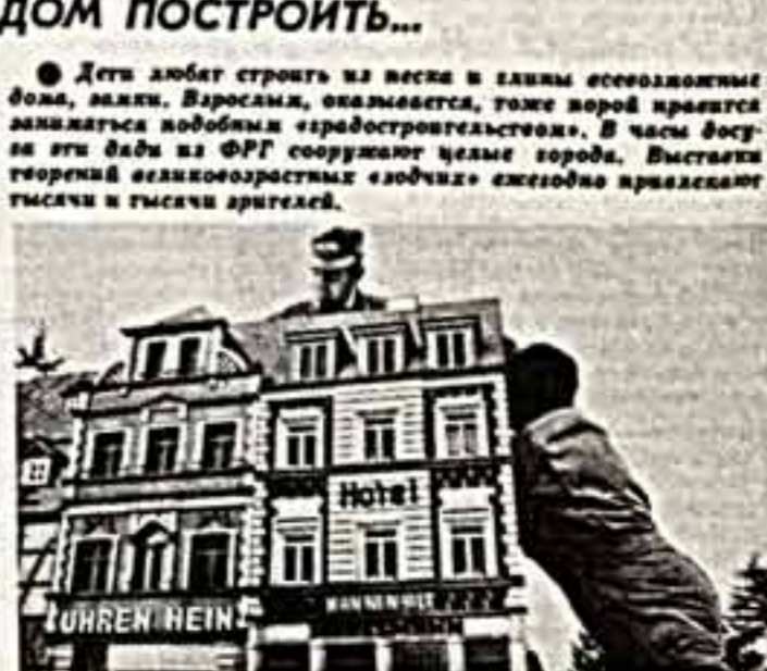
(По сообщению корреспондентов «СК» и ТАСС).