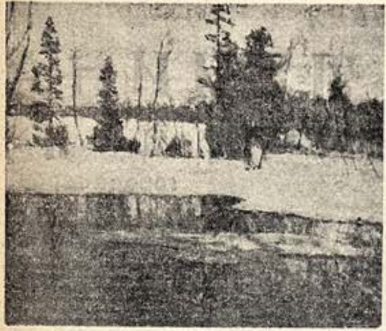
«Весной повеяло» (масло). Художник В. Бялыницкий-Бируля.