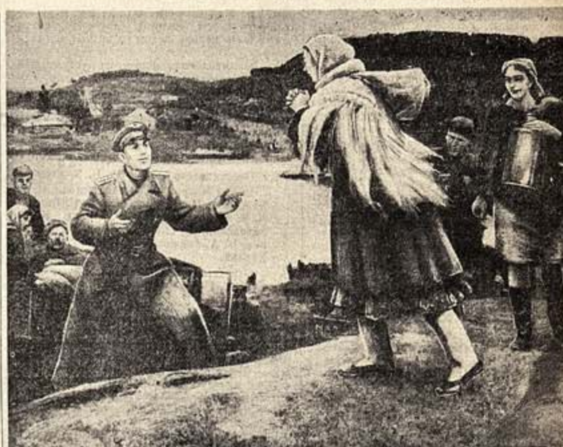
«Сам верузяс» (масло). Художник действительный член Академии художеств СССР С. Герасимов. (Из картины, отобранных на Всесоюзную художественную выставку).