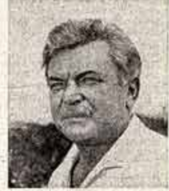
Кадр из фильма «Такие высокие горы».