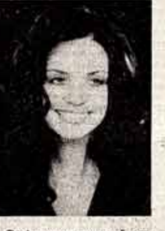
Артистка польской эстрады Эвелина Сосенцка.