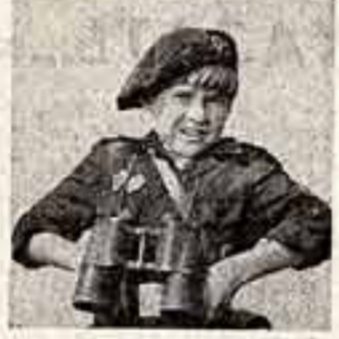
Один из героев фильма «Про Витю, про Машу и морскую пехоту».