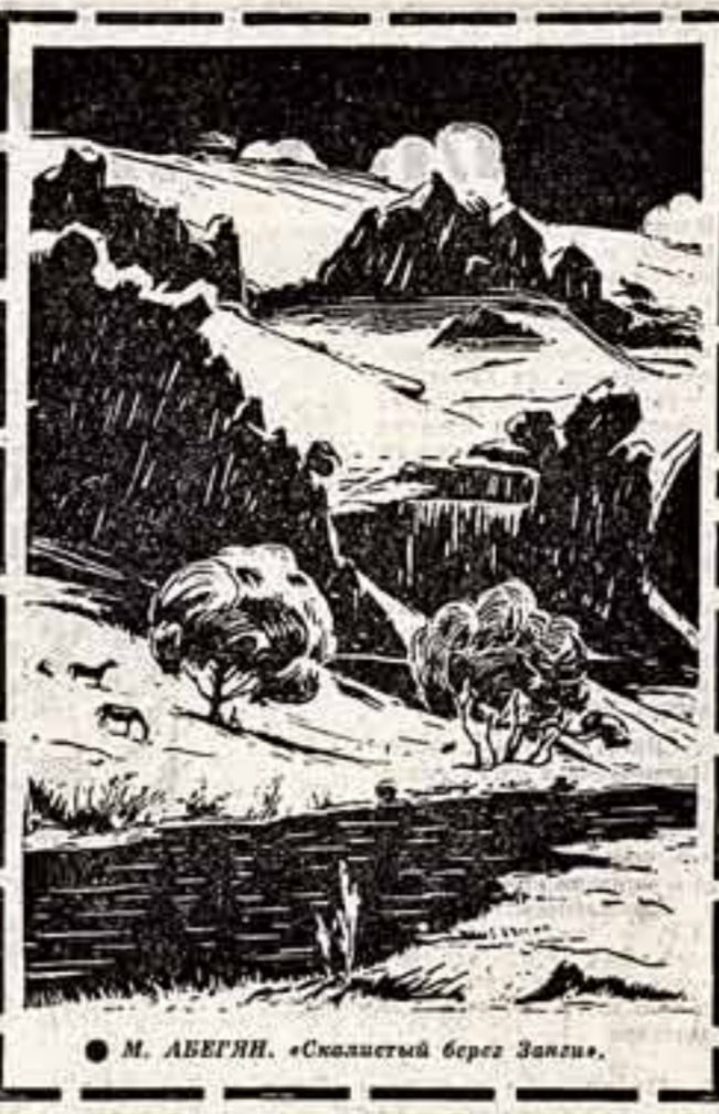
М. АБЕГЯН. «Скалистый берег Занга».