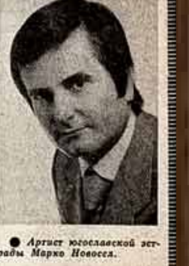
Артист югославской эстрады Марко Новосел.

Музыкальная программа «Мелодии Югославии-74» звучит в Ужгороде, Лявоце, Тернополе, Черновце, Виннице, Одессе, Кировограде, Полтаве, Черкассах и Москве, Групп.