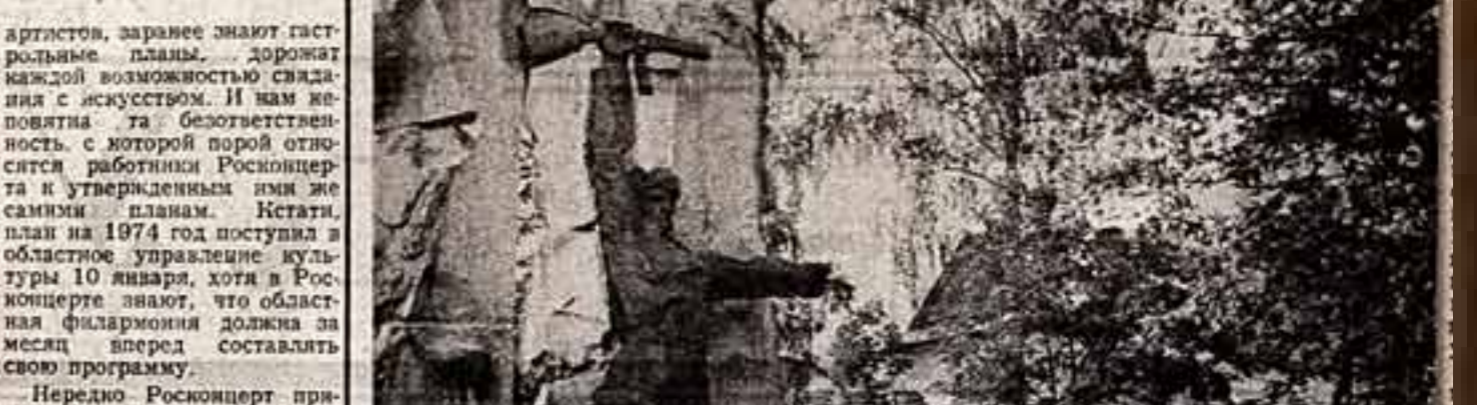
фотококурсе ● И. КОШЕЛЬКОВ. «Рассказ о героях». (У памятника партизанам Колоска в Яржке).

Чем привлекательнее эти планы? Я бы сказала, главным — индивидуальными потребностями разных категорий рабочих, колхозников, служащих, учетом семейных интересов. Последнее для всех нас — очень важное обстоятельство. Как часто еще возникает всякого рода неудачи из-за того, что супруги не могут