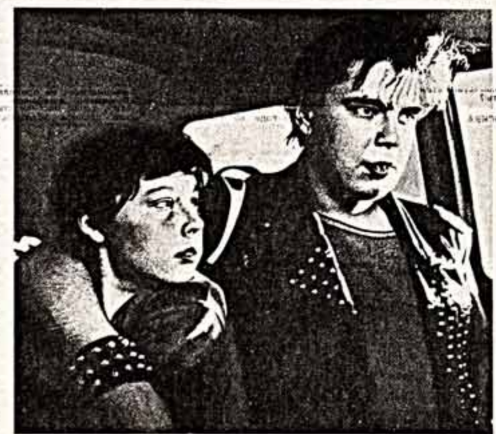
Кадр из фильма «Ночной звонок».

«Амадей» («Союз Зейнц компания, США») — фильм, выходящий в персональном авторском варианте. Значит, это еще и своего рода премьеры.