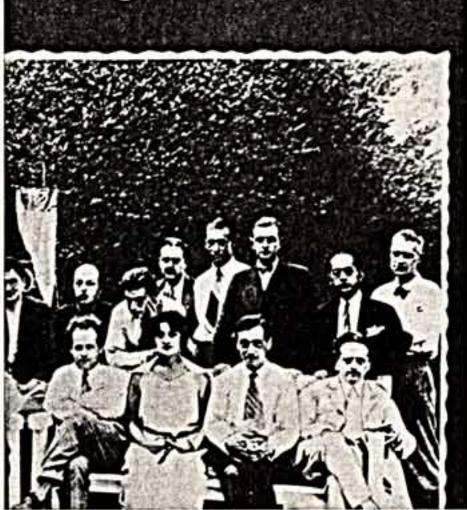
Перелистка Э. Синклера с И. В. Сталиным