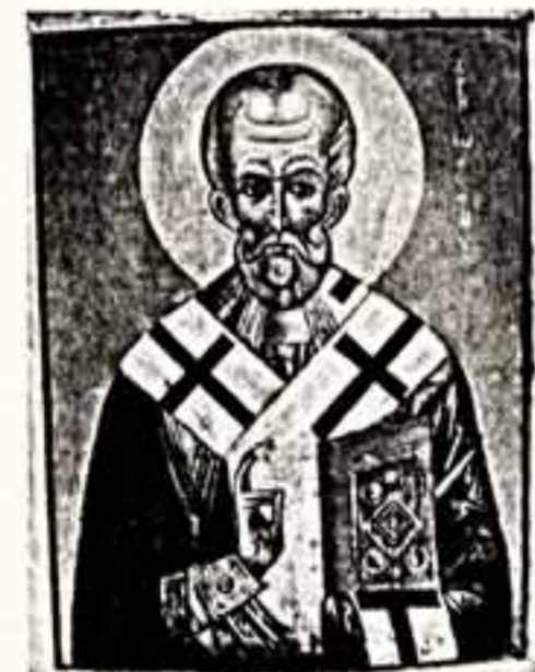
Никола, Новгород, Конец XIII—XIV вв. Москва, XVI вв.