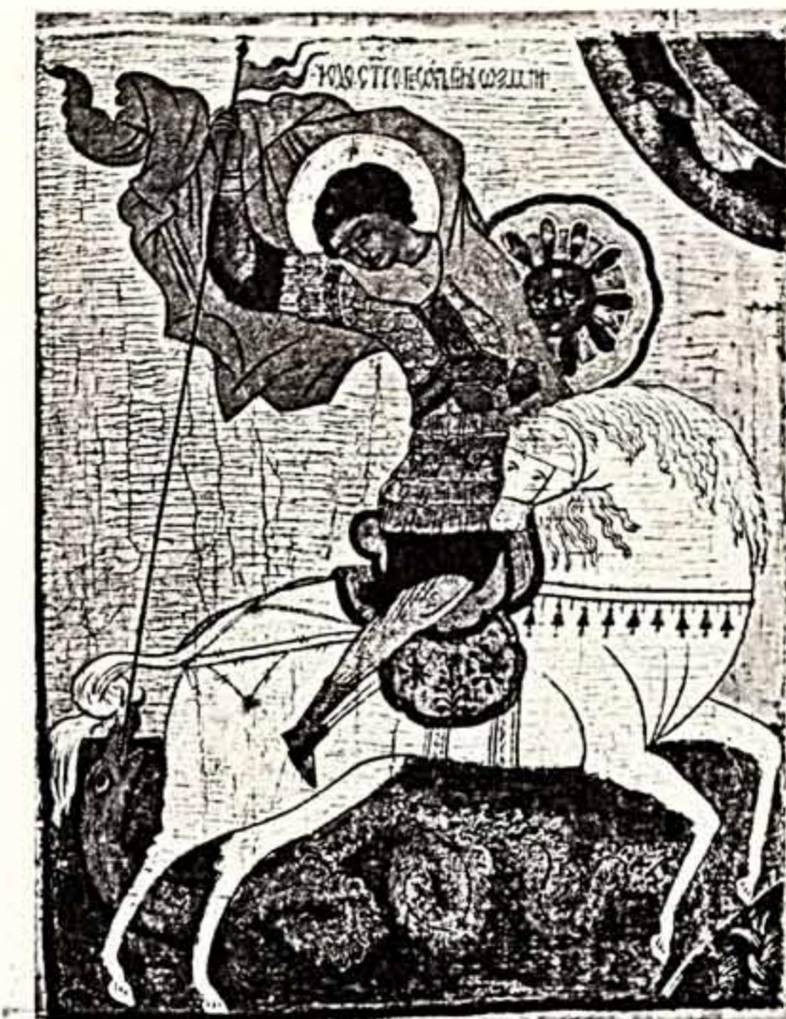
Чудо Георгия о змие. Новгород, Конец XV — начало XVI века.