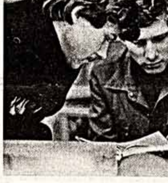
Политика заискусств — великие нашего времени.

В Станице мы живем уже почти год и удивляемся беспечному отношению руководства и населения города к замечательным памятникам архитектуры и к городу в целом. Когда нас послали искать по распределению, мы по описанию в книгах думали, что едем в прекрасный культурный центр, где люди чтут и уважают свою историю, где они бережно охраняют