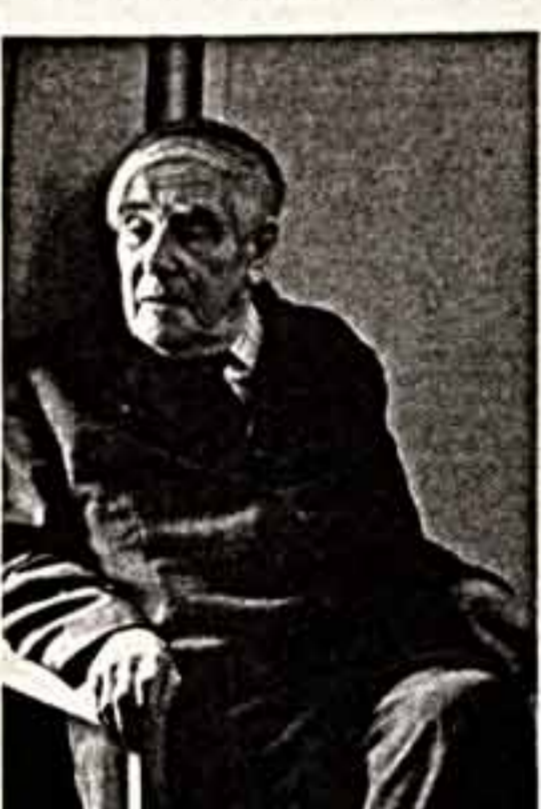
Предварное звание профессора.

Эти примеры показывают, что в инкомиссии надо относиться весьма дружелюбно к Бернштейну, как это делал Ленин. Инкомиссия тесно связана с полемикой творческой деятельности человека, а творческая деятельность в любой отрасли культуры обеспечивает прогресс человечества.