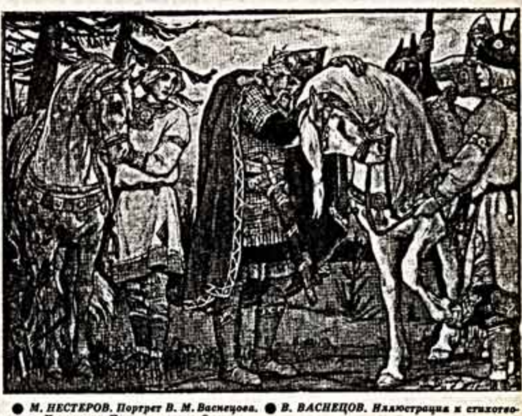
М. НЕСТЕРОВ. Портрет В. М. Васнецова. В. ВАСНЕЦОВ. Иллюстрация к стихотворению Пушкина «Письмо вещем Олегу».