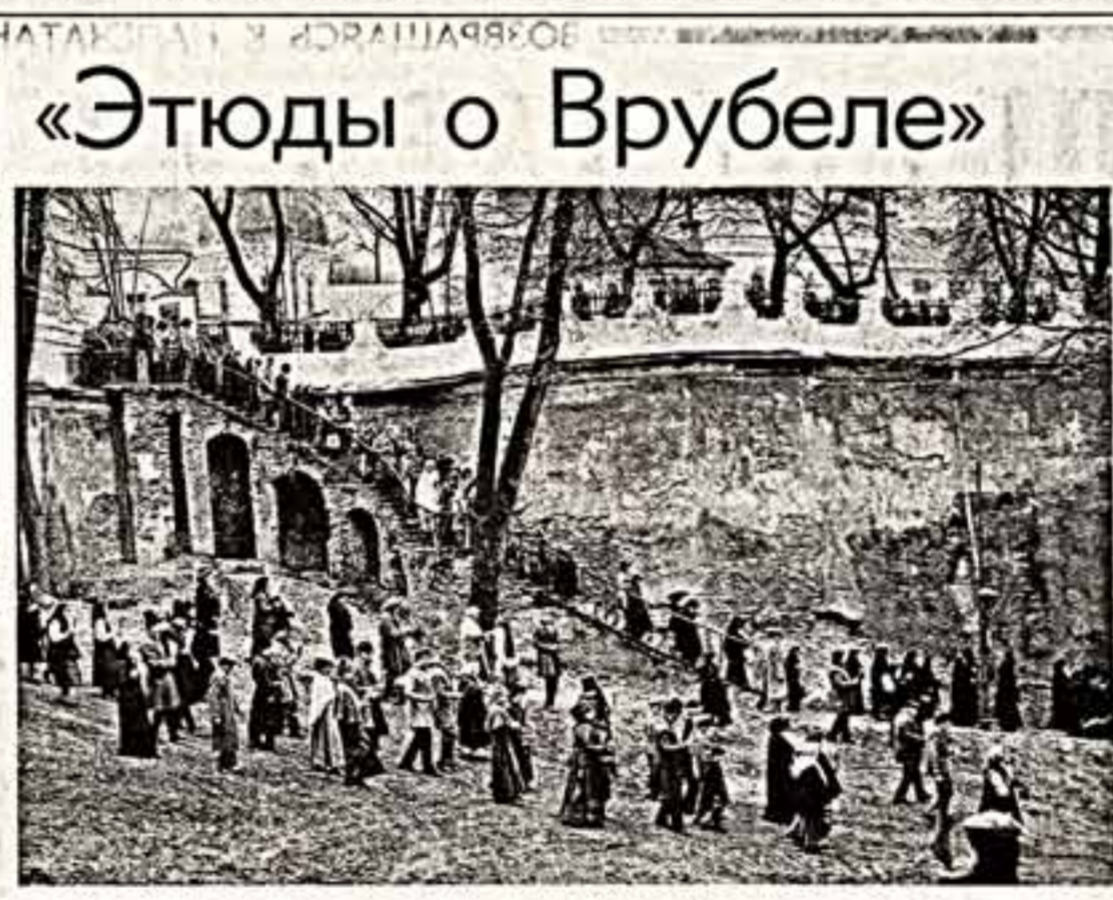
Первые съемки в Киевско-Перечском заповеднике. Режиссер-постановщик Леонид Осипа.