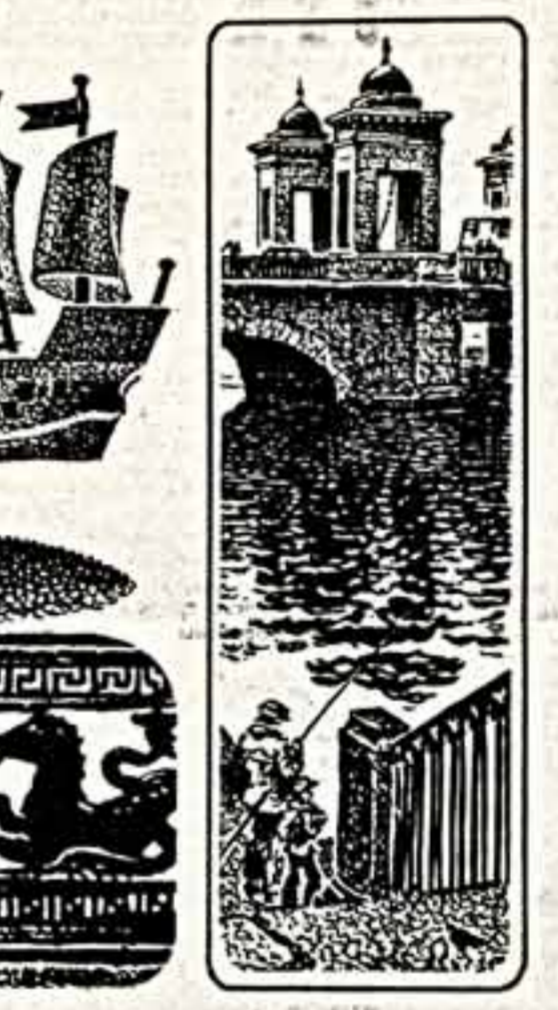
Рисунки Анатолия Михайлова.