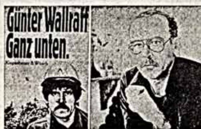
Обложка новой книги Г. Вальрафа о портрете автора на фоне турецкого рабочего Ала. Гюнтер Вальраф.

Гюнтер Вальраф — представитель протестантской церкви, который благодарит мажоритаризм с рабочей силой ежегодно вращает миллиарды. Он выдвигает в качестве такового торговца людьми, который вынужден выдать даже из беднейшего из бедных (по словам самого Адлера).