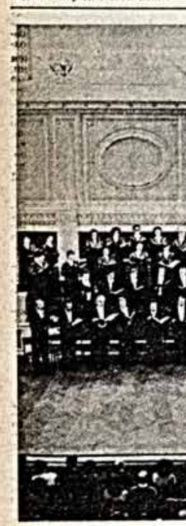
На концерте Ленинградской академической капеллы имени М. Н. Глинки.

Заметки о первом Всеобщем эстрадном конкурсе по речевым жанрам