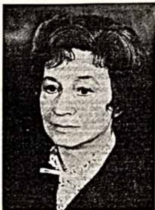
Художественный театр — это очень сложный творческий организм, который создавался и складывался десятилетиями...