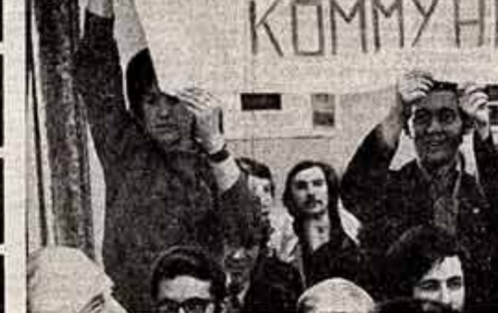
С большой ответственностью следил за работой XXV съезда КПСС преподаватель и студент Московской государственной консерватории им. П. И. Чайковского.

Начинание дружного коллектива — это и есть начало работы XXV съезда КПСС преподавателями и студентами Московской государственной консерватории им. П. И. Чайковского.