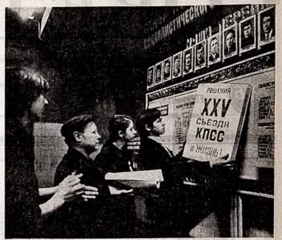
Большие задачи по пропаганде решений XXV съезда КПСС стоят перед пропагандистами и агитаторами предприятий, строек, совхозов и колхозов нашей страны...