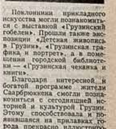
Поклонники прикладного искусства могли познакомиться с выставкой «Грузинский собор»...