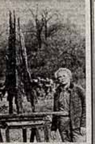
Известный польский скульптор Бронислав Хромый завершил работу над монументом...