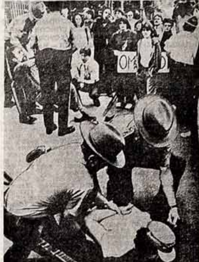
Тан расправился «страны порядка» с участниками широчайшей манифестации в городе Гайфоне...