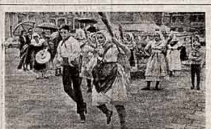
На улицах Вены.