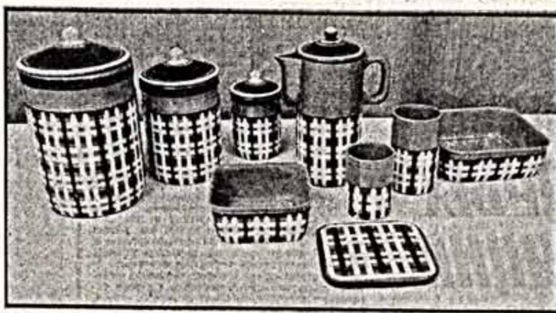
С древних времен крупным центром южнорусского производства был Псков. Археологические раскопки подтверждают это. В XIX веке промысел уходит из пределов города...