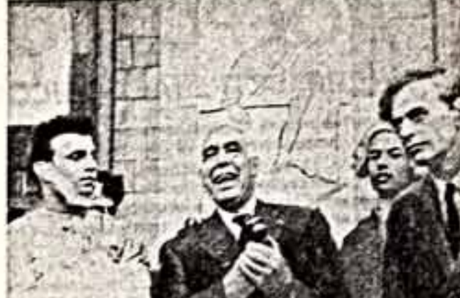
Физика. По «Дню Арминеда» идет отсчет годам и существует по сей день в Доме культуры Института имени Курчатова очереда студия «Арминеда».