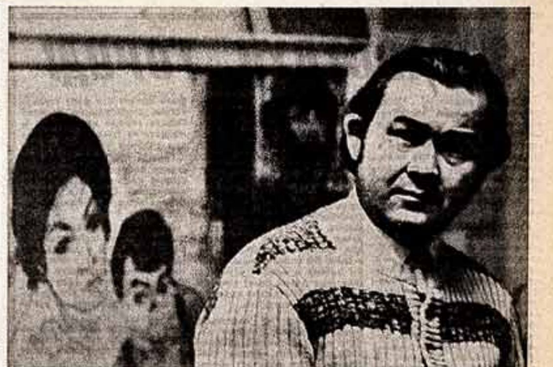
люди искусства БАТЫР ЗАКИРОВ, народный артист Узбекской ССР