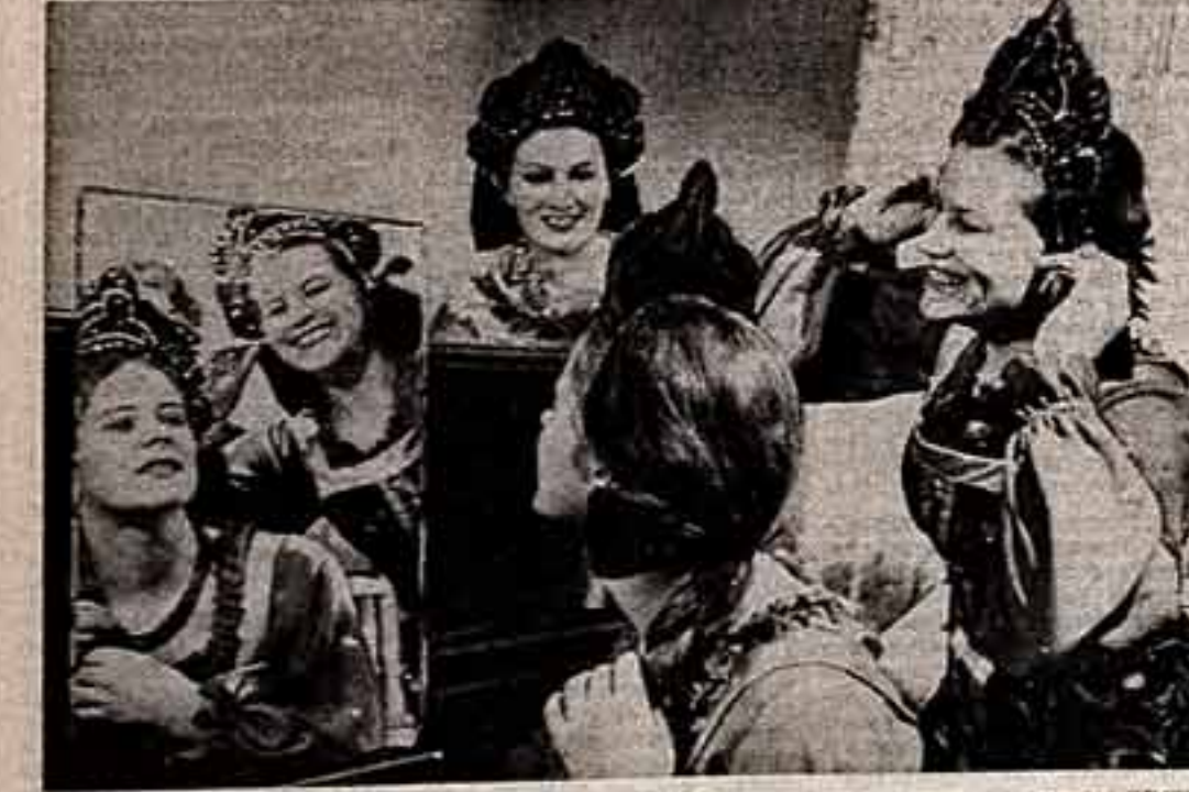
В студенческая общага Ленинградского государственного института культуры имени Н. К. Крупской каждая ночь бывает шумно. Здесь устроены тематические вечера, встречи с коллекторами и артистами...