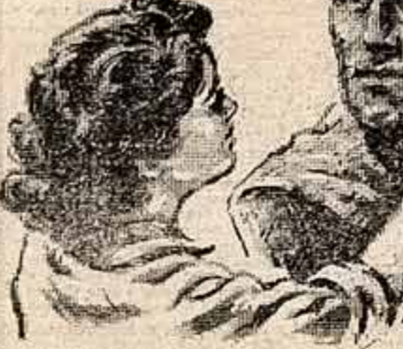
Аллах ХОРАВА, народный артист СССР.

КОМПЛЕКТ ТЕМАТИЧЕСКИХ ПЛАКАТОВ посвященных материалам декабрьского Пленума ЦК КПСС, выпустило Издательство политической литературы. Десять красочных листов рассказывают об успехах в развитии экономики страны, достигнутых под руководством Коммунистической партии Советского Союза за великое десятилетие, о достижениях химической промышленности СССР за последние пять лет, о новых рубежах большой химии в преддверии семилетия. Массовое издание может быть использовано для выставок в домах культуры и клубах.