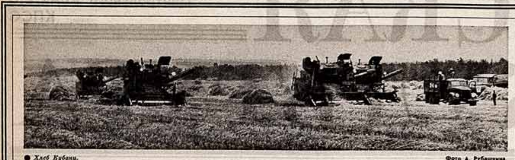
Хлеб Кубани.