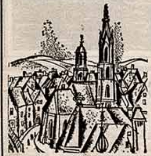
Город Шапур по праву можно назвать красивейшим из старых венгерских городов.

В 1963 году средневековый центр города был объявлен архитектурным заповедником и были начаты работы по мемориальной реставрации зданий. Уже через десять лет, в 1973 году, Шапур был награжден премией Европы, присуждаемой за образцово проведенные реставрационные работы.