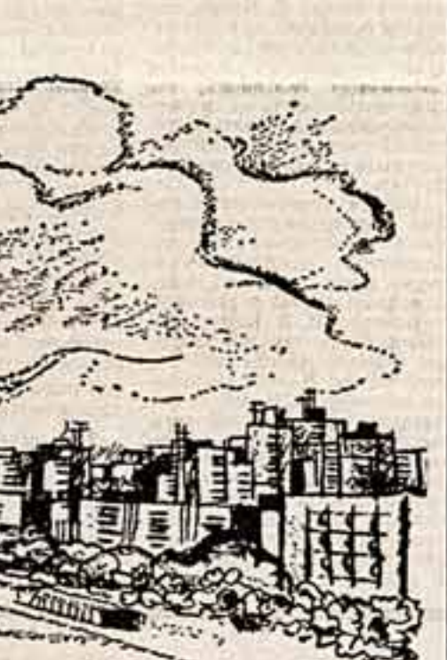
Г. РАТНЕР, Рисунок автора.