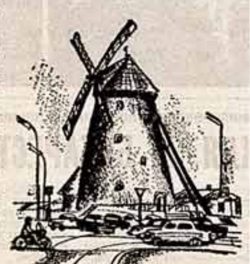
Г. РАТНЕР, Рисунок автора.