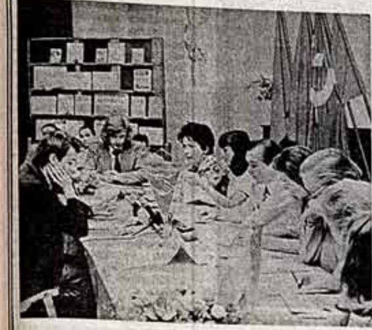
Заседает жюри олимпиады талантов в Советском Союзе. Справа на альбоме «Культура обходит народы».