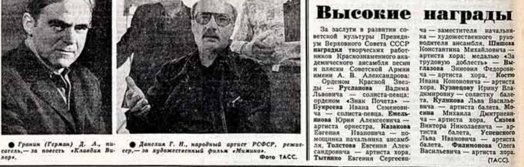
Гранин (Герман) Д. А., писатель, — за повесть «Клавдия Ворона».