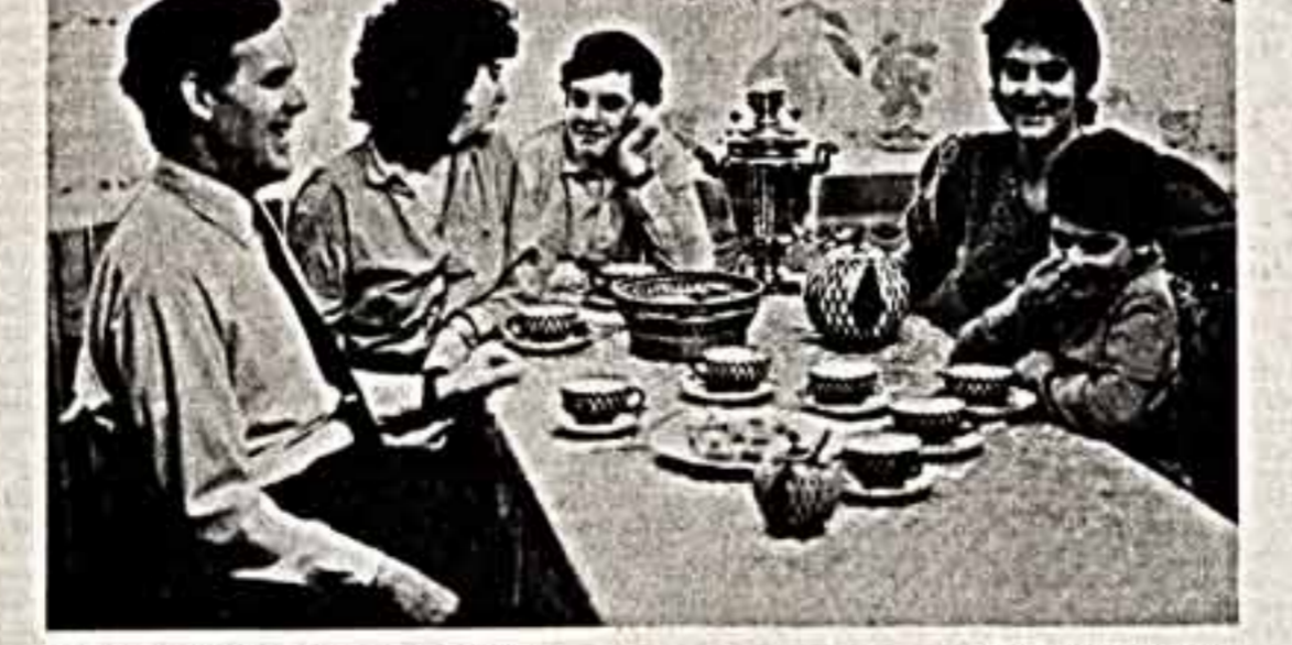
Москва. Вечер у семейного самолета.

Вспрос: Почему вы не об-... щались с арестованными?