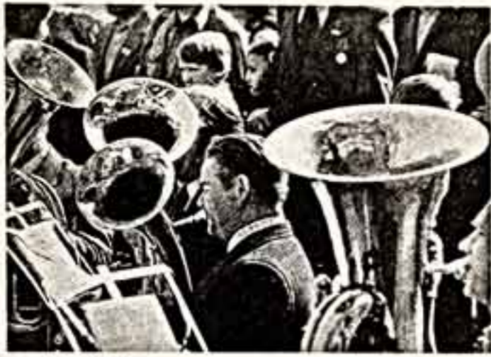
— 1 пр. 17.30.