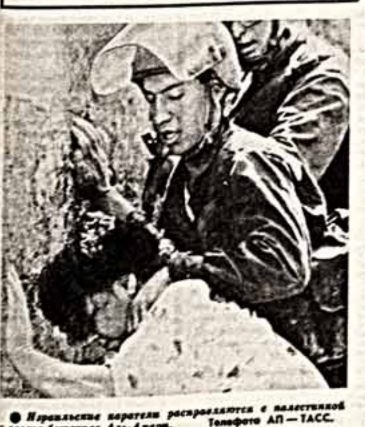
Иллюстрация к статье «Заметки реалиста» в газете «Советская культура»