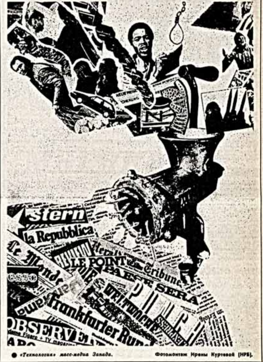
«Технология» масс-медиа Запады.

В одном из самых престижных залов французской столицы — Парижском музыкальном театре — состоялась торжественная церемония присуждения главных наград французского театра, носящих имя великого Мольера.