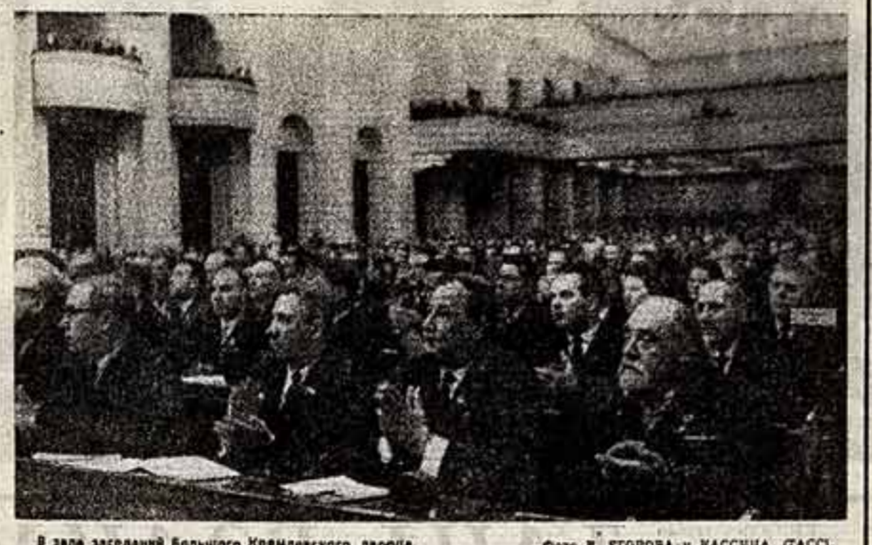
В зале заседаний Большого Кремлевского дворца.