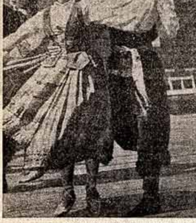
Создание советских национальных оперных театров — блестящий пример верности лучшим традициям прошлого и в то же время смелого новаторства. Новаторство не отвергнутое, а развивающее вековые традиции. Об этом истинно напоминает сейчас, когда все мы под свежим впечатлением живительных бесед руководителей партии и правительства с деятелями литературы и искусства снова громко заговорили о много «давних известных» источниках.