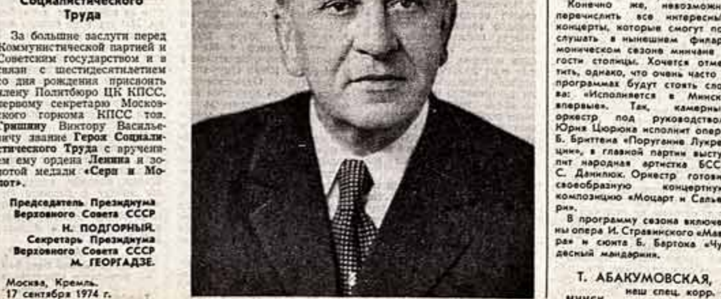
Центральный Комитет КПСС Президиум Верховного Совета СССР Совет Министров СССР