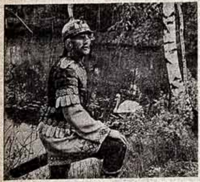
Финист Ясный Сокол.