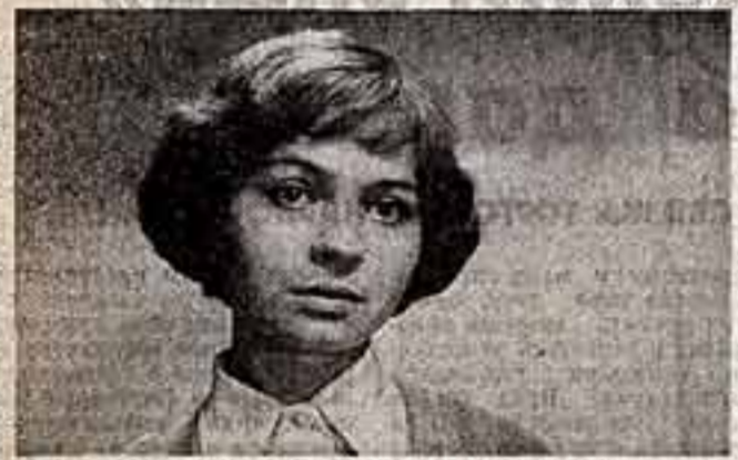
Кадр из фильма «Сто процентов надежды».