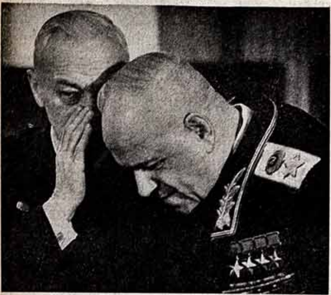
В. МАСТУКОВ, Маршал Советского Союза Г. К. Жуков в народный артист СССР кинорежиссер Р. Л. Кармен (1965 год).