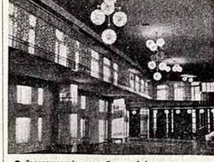
● Драматический театр в Томске. Файе.

Драматический театр, построенный к 375-летию основания Томска, органично вошел в ансамбль центральной площади, носящей имя В. И. Ленина. В будущем здесь будут возведены здания обкома КПСС и облсплокома, Дома нефти, высотной гостиницы. Градостроительное значение площади как административного, политического и культурного центра Томска предельно и создателям проекта — ленинградским архитекторам Т. Милославской и Г. Армизеровой (ЦНИИЭП зрелищных зданий) — особые требования.