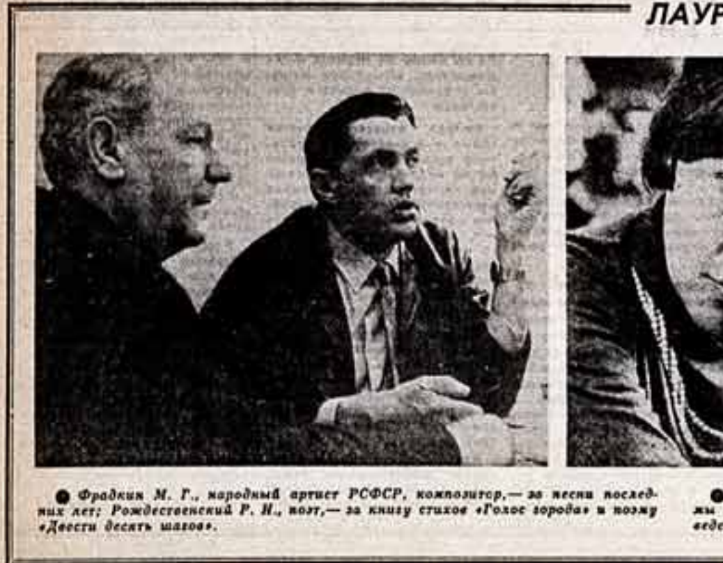
Фрадкин М. Г., народный артист РСФСР, композитор, — за песни последних лет; Рождественский Р. Н., поэт, — за книгу стихов «Голоса городов» и поэму «Десяти тысяч шагов».