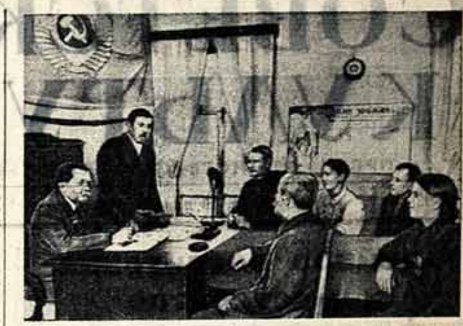
Академик К. И. Скрыбин беседует с группой колхозников-животноводов Ярославской области.