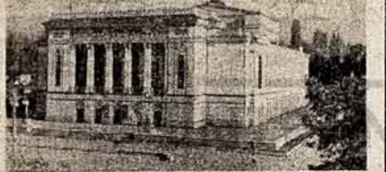
Советский Киргизстан торжественно отметил свой 45-летний юбилей. На верхнем снимке фотокорреспондент П. Федорова — Казанский академический театр оперы и балета имени Абай в Алма-Ате.

ТУНИС. (СК — ТАСС). В тунисском городе Кельбия открылся международный фестиваль кинематографистов-любителей. В нем примут участие более 130 молодых кинематографистов различных стран.