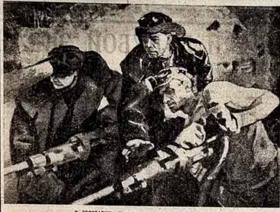
В. ЗОЛТАВИН. «Шахтеры-проходчики». Фрагмент.