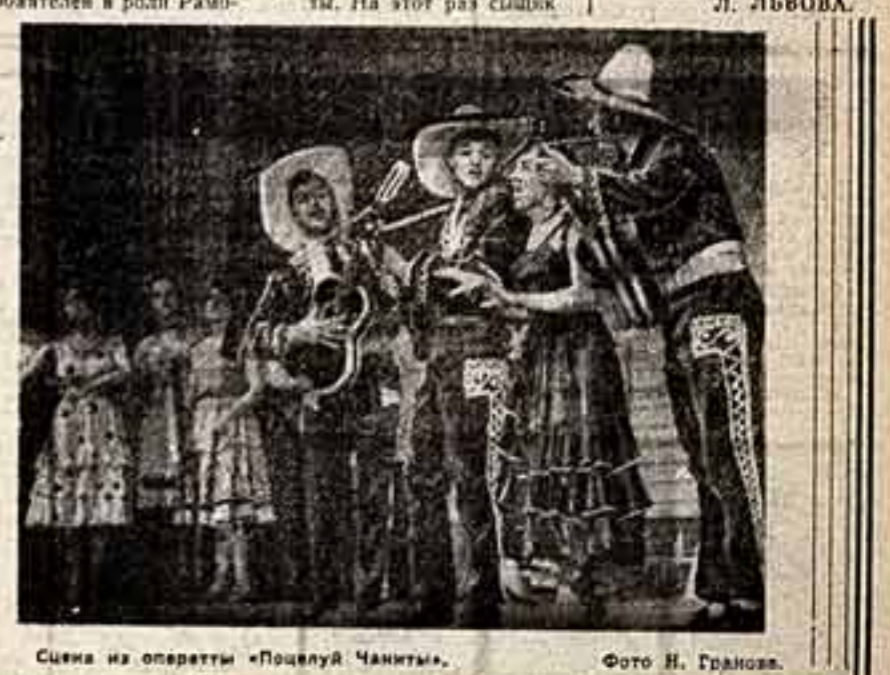
Сцена из оперетты «Поцелуй Чаниты».

граммки: «инженер, лесоруб, танцевальца, легко, но разве танцевать в этом деле?» Казалось бы, вот он — опереточный «просто», со всеми его каноническими приемами.